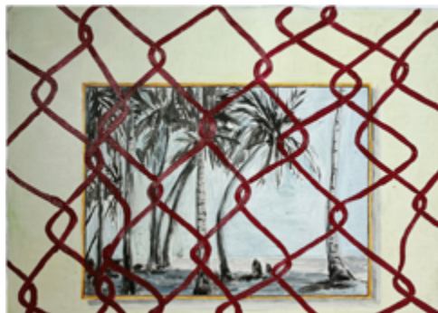
Figura 10. Luis Mata: Litoral (2023). Óleo sobre lino. 30 x 40 cm. Cortesía del artista.

Contemplar las ruinas nos conduce así ante la presencia de un tiempo puro, «un tiempo perdido cuya recuperación compete al arte» (Augé, 2003, p. 7); de allí que las obras tanto de Portillo como de Mata —pese a enunciarse desde una actualidad reciente— hablan de «un tiempo al que no puede asignarse fecha [...], que no se ubica en nuestro mundo violento, un mundo cuyos cascotes, faltos de tiempo, no logran ya convertirse en ruinas», permitiendo así preguntarnos: ¿es posible hablar de ruina en un espacio donde la vida continúa existiendo?, ¿qué diferencia a la ruina de la precariedad?, [8] ¿cómo se habita un paisaje sumido en la destrucción?