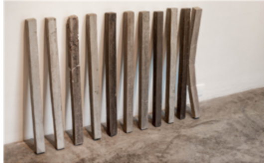
Figura 15. Jonathan Lara: S/T. Principios Constructivos (2022). Mezclas de cemento, pigmentos, acrílico, aserrín, madera, hierro. Medidas variables.

De igual manera, desde un ámbito exformal, las propuestas de Jonathan Lara trabajan a partir de las fuerzas de aquello que cae más allá de la gravedad, utilizando los jirones de sus propios procesos de taller para dar cuenta de una situación contextual convertida en objeto de mirada y detalle. Como nuevo habitante de la ciudad, Lara desarrolla una aguda observación de la tectónica de la arquitectura en deterioro, lejos de toda mirada nostálgica del otrora para dar paso a un espectáculo de la desolación.