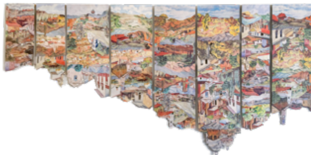
Figura 3. Manuel Eduardo González: Rafael Monasterios 1984 (De la serie Sedimentaciones) (2018). Papel impreso, cortado y ensamblado. 75 x 150 cm (8 partes). Cortesía del artista.