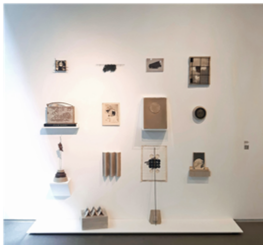
Figura 5. Eduardo Vargas Rico: Construcción Arqueológica Para la Introducción Cartográfica al Atlas de Venezuela (2022). Instalación. Medidas variables.

de la organización de los elementos y la creación de nuevos presupuestos.