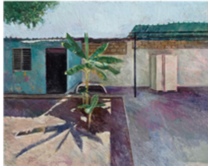
Figura 9. Jurgens Portillo: Patio 3 (2022). Óleo sobre madera. 24 x 30 cm. Cortesía del artista.

Contemplar las ruinas nos conduce así ante la presencia de un tiempo puro, «un tiempo perdido cuya recuperación compete al arte» (Augé, 2003, p. 7); de allí que las obras tanto de Portillo como de Mata —pese a enunciarse desde una actualidad reciente— hablan de «un tiempo al que no puede asignarse fecha [...], que no se ubica en nuestro mundo violento, un mundo cuyos cascotes, faltos de tiempo, no logran ya convertirse en ruinas», permitiendo así preguntarnos: ¿es posible hablar de ruina en un espacio donde la vida continúa existiendo?, ¿qué diferencia a la ruina de la precariedad?, [8] ¿cómo se habita un paisaje sumido en la destrucción?