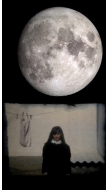
Figura 20: Julia Zurilla: Horizonte Menguante (de la serie Horizontes Verticales) (2022). Duración 3 min. Video collage. Formato HD. Proyección vertical en monitor.

En el caso de Julia Zurilla, el ensamblaje digital de imágenes en movimiento permite a la artista establecer un lazo directo entre la existencia humana (la suya en particular) con la inmensidad del cosmos. Esta articulación da forma a la serie de videos Horizonte Vertical (2017-), en la cual el característico panorama apaisado de las memorias familiares establece una relación cenital con los astros, dando lugar a un espacio donde la vida humana, frágil, ínfima y poco trascendental es comparada con la existencia inmedible del Sol — Bravo Horizonte (2017) (figura 19)— o la Luna —Horizonte Menguante (2022) (figura 20)—, y viceversa: la inconmensurabilidad del universo con el ser individual.