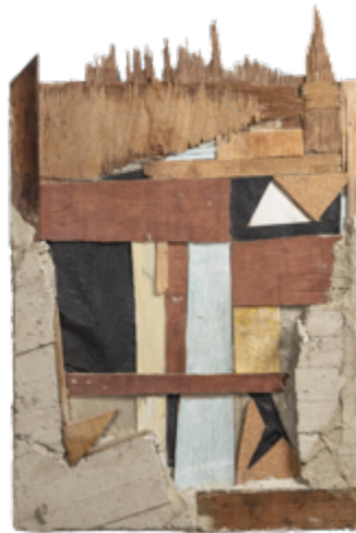
Figura 14. Federico Ovalles: Sustrato #8 (2022). Cemento, madera y escombros de construcción encontrados y ensamblados sobre madera. 80 x 60 cm.

Generalmente, descartados de toda función, los residuos se convierten en desechos que perecen ante la imposibilidad de cumplir con el objetivo que propició su origen (aunque no dejen de existir en su condición tangible). Empero, los residuos hallados por Ovalles y tomados del descarte de la vida urbana encuentran nuevas finalidades al ser aglomerados y unificados en los formatos trabajados por el artista; de allí que, una vez convertidos en soporte físico, los Sustratos (figura 14) de Ovalles abandonan toda lectura ruinista para brindar posibilidades poéticas del origen del paisaje como superficie de germinación de nuevas formas de existencia en su propia heterogeneidad material.