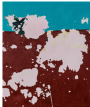
Figura 11. Génesis Alayón: Pared Bicolor 1 (2022). Óleo sobre tela. 71 x 61 cm. Cortesía del artista.

El paisaje local se entiende así en la obra de Alayón desde una vulnerabilidad intrínseca en el paso del tiempo, siendo este un concepto muy presente en la manera de construir sus imágenes y visible en obras como Pared Bicolor 1 (2022) (figura 11), donde este transcurrir detona posibilidades para su lectura: como origen del fenómeno sustractivo de las capas de pigmento, de la desertificación de la superficie habitable, de la pérdida de la materialidad construida. Por otro lado, como en todo proceso pictórico, lo temporal aparece como una determinante para representar (o volver a traer) una imagen que detiene a la ruina, que captura su paso. Esta intención nos lleva nuevamente al tiempo puro, un «tiempo sin historia del que únicamente puede tomar conciencia el individuo y del que puede obtener una fugaz intuición gracias al espectáculo de la ruina» (Augé, 2003, p. 47). De esta manera, al observar las pinturas de Génesis Alayón nos encontramos frente a los remanentes de un paisaje cuya pérdida se ha detenido (mas no recuperado) y que desde su condición perenne afirma su inevitabilidad.