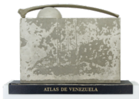
Figura 6. Eduardo Vargas Rico: Atlas de Venezuela (Naturaleza Muerta) (2022). Escultura. Cortesía del artista.

Estos objetos, manipulados, retomados del desuso y el descarte, y posteriormente convertidos en arte, especulan sobre la resignificación de los saberes implicados en la pérdida histórica del paisaje, así como sobre la transformación irreversible de las imágenes del mismo, lo que se enuncia en la relación titular de la obra Atlas de Venezuela (Naturaleza Muerta) (2022) (figura 6), siendo este último un capítulo específico de la historia del arte occidental, donde la extracción de elementos del paisaje permite estudiarlos en su inercia y descomposición.