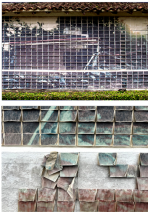
Figuras 7 y 8: Teresa Mulet, Libro-Mural: Archivo-Ruina: La Casa en la Intemperie [detalle] (2022). Inyección de tinta sobre papel. Medidas variables.