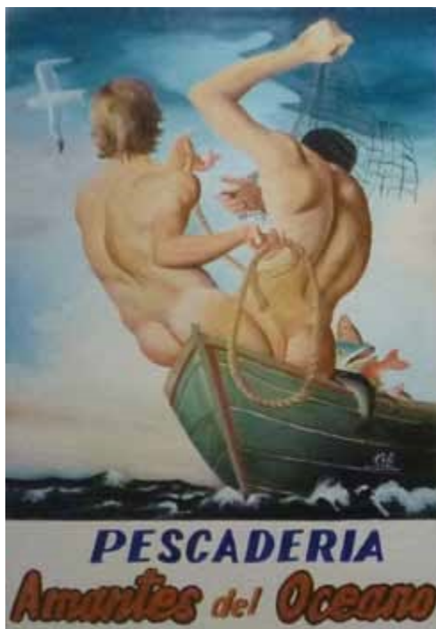
Andrade, X. (2013). The Full Dollar Collection [imagen]

ciertamente no alude a dinámicas locales, y por otro lado está la idea de jugar con el nivel de conocimiento que tenemos sobre esas tradiciones. Además, el arte juega con estrategias con las que me identifico plenamente porque los códigos de corrección política de la academia me resultan extremadamente aburridos. El sarcasmo, la ironía, la parodia, esos códigos que están excluidos de la academia me permiten hacerlos patente en todos los proyectos que hago con Full Dollar. El arte me salva de la academia, aunque lo que hago sea antropología por otros medios.