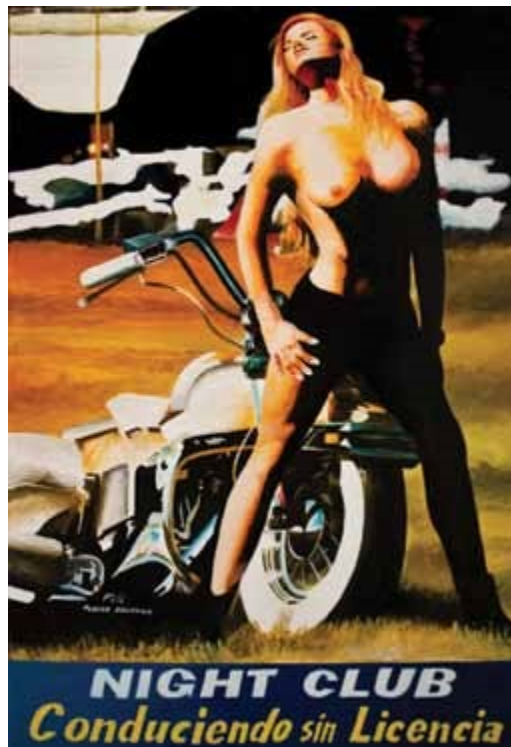
Andrade, X. (2013). The Full Dollar Collection [imagen]

HB: Es interesante pensar también que todo esto es muy benjaminiano, en el sentido de «la obra de arte en la era de la reproductibilidad técnica». Creo que nunca se aboga o se espera el original. Vivimos en un mundo de falsos, de copias de las copias. Escoge un ámbito y es un reciclaje. Vivimos eternamente en el pasado, citando a Jameson o a Appadurai. Entonces, ¿cuál es el siguiente nivel de discusiones que podemos punzar, potenciar o movilizar?