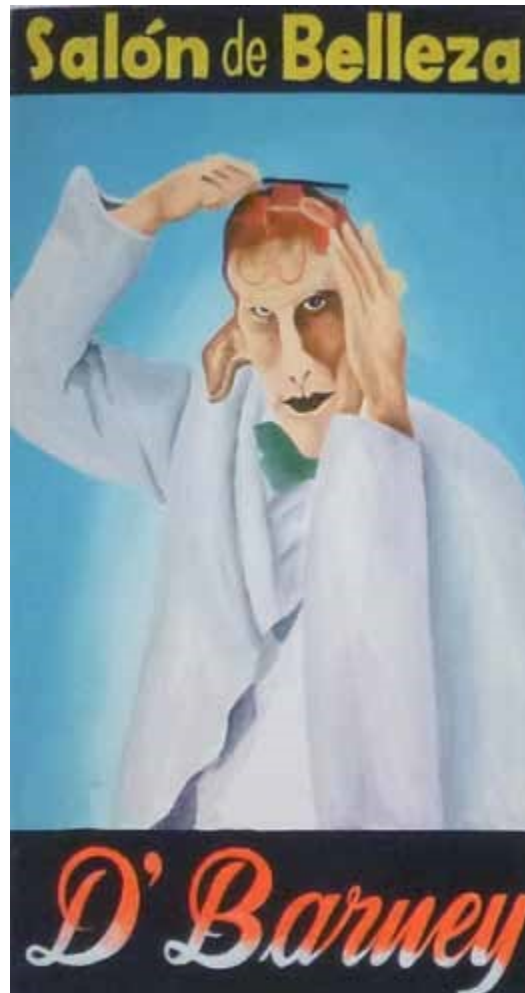
Andrade, X. (2013). The Full Dollar Collection [imagen]