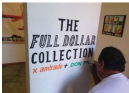
Andrade, X. (2013) [fotografía]

diferente. Ha generado probablemente una serie de sospechas de parte de Don Pili hacia mí, sospechas en el buen sentido. No se han desatado tensiones, pero sí preguntas sobre el modus operandi del arte. Mi posición es más compleja que en una etnografía tradicional porque en este momento puedes leer mi rol como el de un marchante de la obra de Don Pili, como un curador, o como un coleccionista de la obra que forma parte de mi colección privada de arte que ahora se hace pública y sale por primera vez a la venta. Porque así nació el proyecto, con el afán de crearme —para mi propio consumo— una colección de arte contemporáneo en el lenguaje de la rotulación popular.