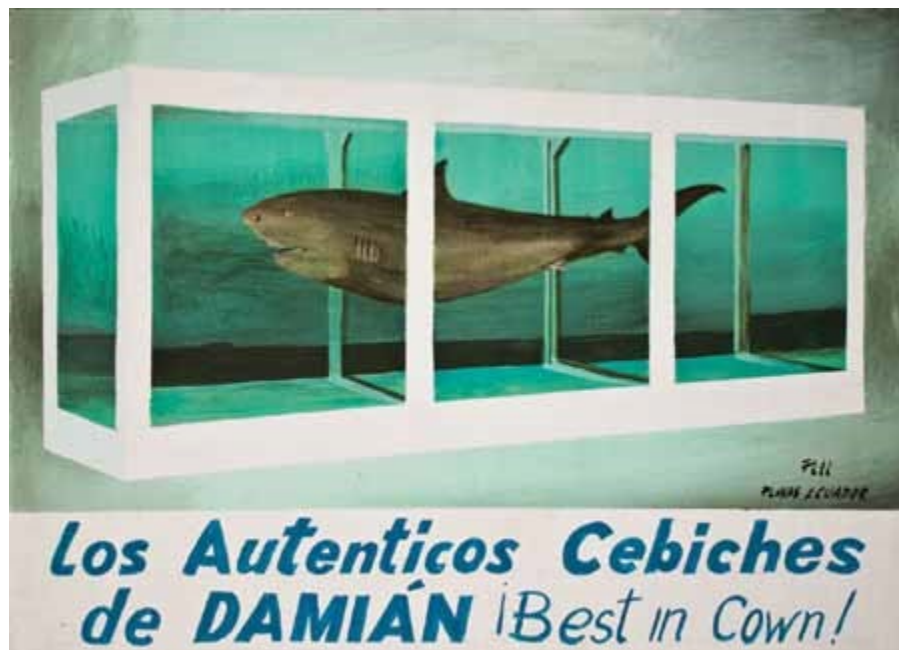
Andrade, X. (2013). The Full Dollar Collection [imagen]

XA: Claro. En los tiburones de Hirst —que son los únicos que son réplica de réplica estrictamente hablando dentro de la serie— se ve claramente que ambas versiones son hartamente diferentes. El de arriba es el original y el otro es su copia, pero viene con una tipografía distinta, otro tamaño, otros colores... Y ver eso es fascinante, porque abre preguntas sobre qué significa hacer una réplica y hacer evidente las variaciones que se dan a nivel manual, que fueron elecciones deliberadas de Don Pili, para que el cuadro no sea una copia, pese a que esa era la consigna.