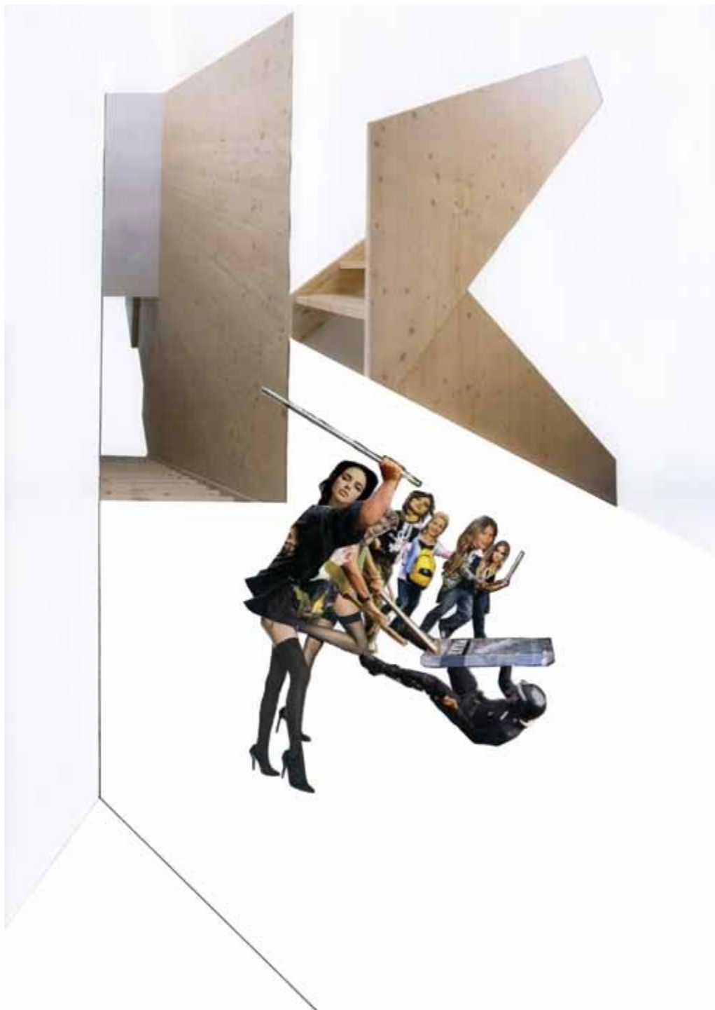
Echeverría, C. (2013) [collage]