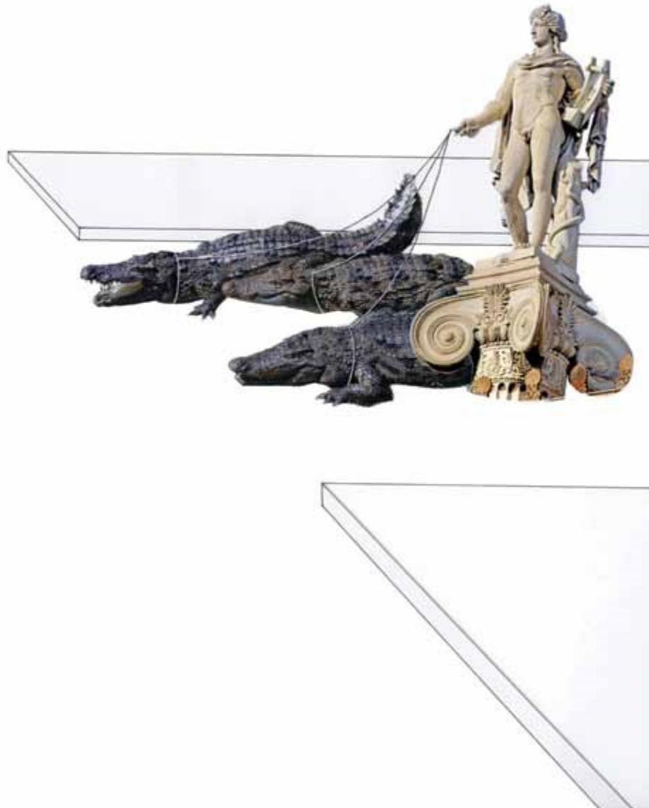
Echeverría, C. (2013) [collage]