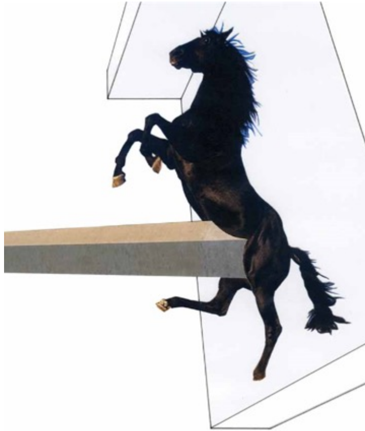
Echeverría, C. (2013) [collage]