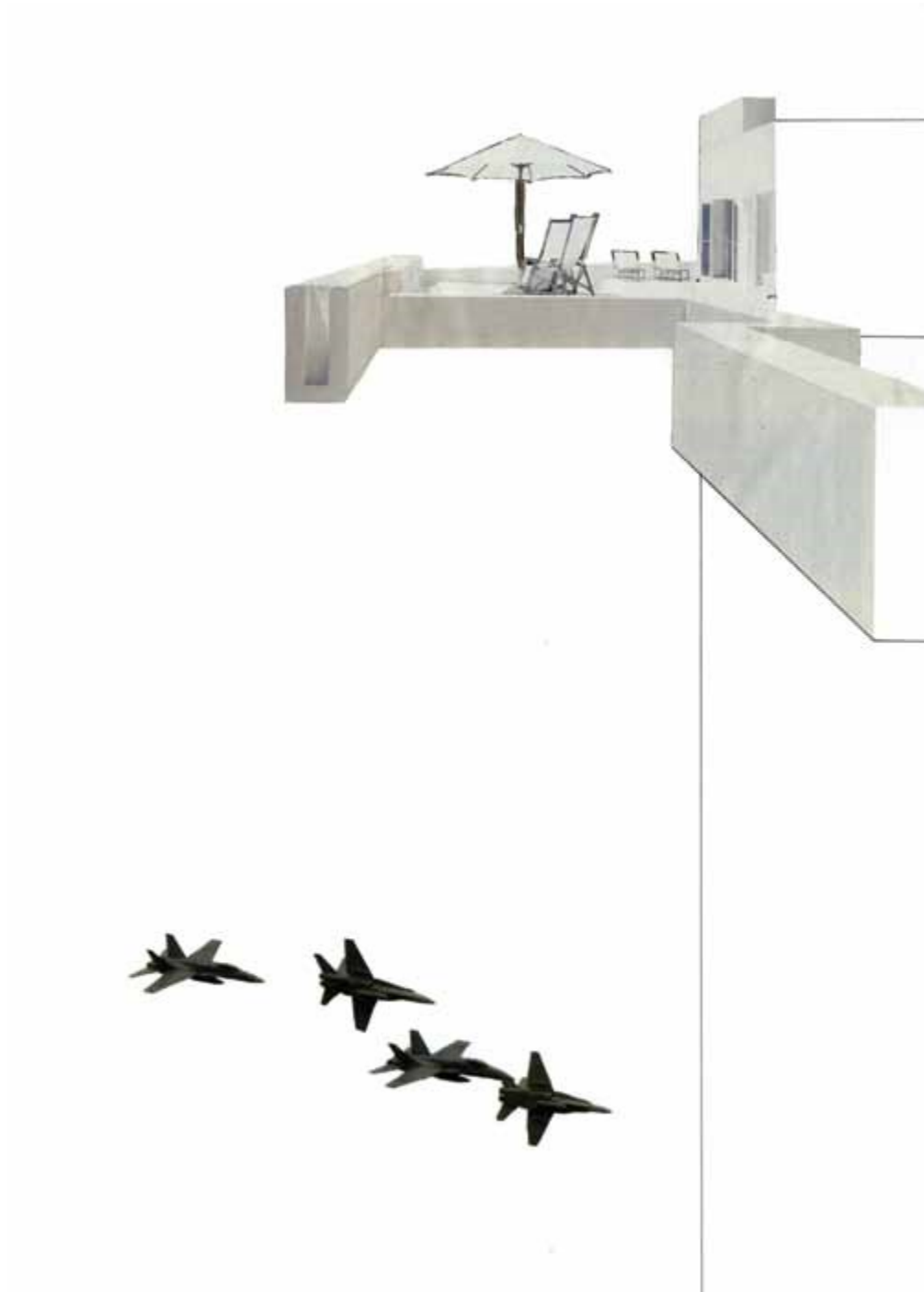
Echeverría, C. (2013) [collage]