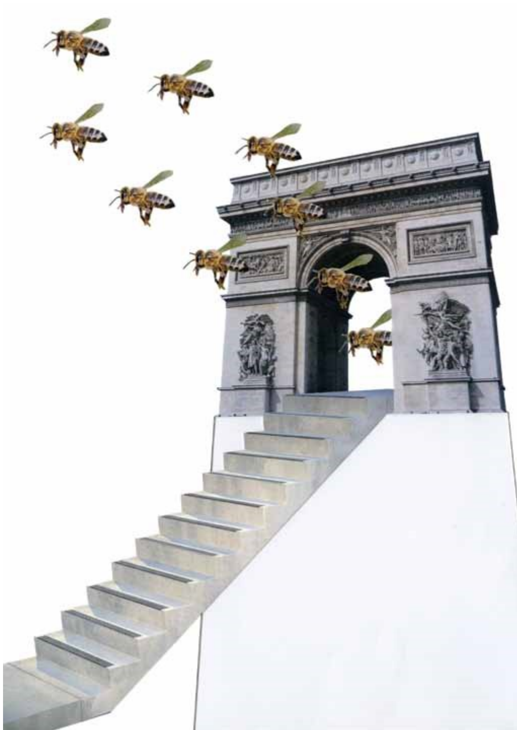
Echeverría, C. (2013) [collage]

Echeverría, C. (2013) [collage] Breathless from the strained vigilance, breathless from the oppressiveness of the stuffy night-air... Hermann Broch, The Death of Virgil 1