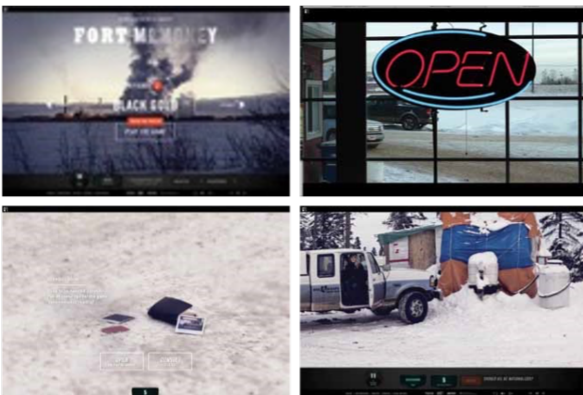
Fort McMurray.

Rosental Alves, profesor de la Universidad de Austin, dijo el 7 septiembre de 2013, en su conferencia de cierre del Primer Congreso de Periodismo Digital de la Universidad Mayor en Chile y Primer Congreso Internacional SEAP Chile: “El periodismo de la era posindustrial. El futuro llegó”, que el mejor enemigo de un medio escrito es el editor de talento, tan especializado y tan competente que atrasa el momento de la inevitable evolución de este mismo medio. Los juegos serios en periodismo deben ser considerados como un nuevo formato que, al igual que otros, tiene sus pros y contras. Aunque requieren de estudio y experimentación, su potencial no debe ser desaprovechado.