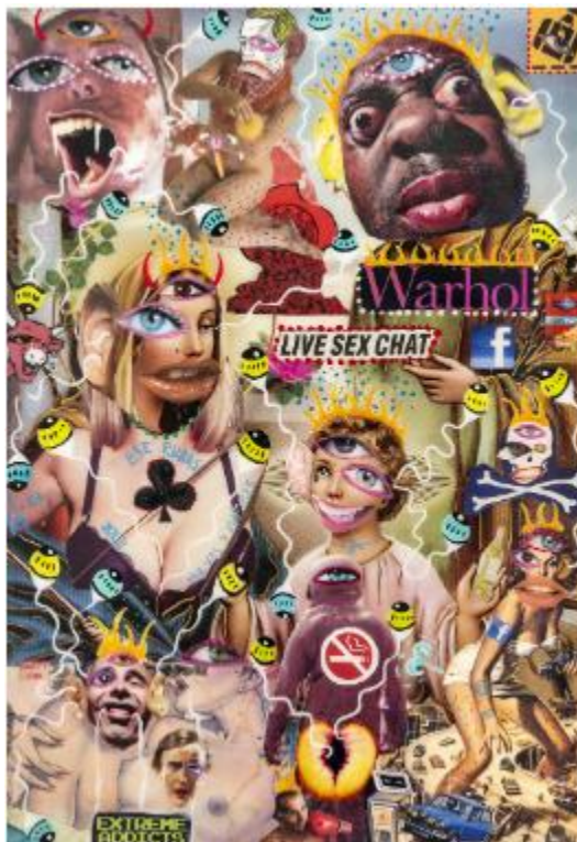
Vade Retro, 2022. Collage, resina líquida y pintura. 36 x 33,5 cm.