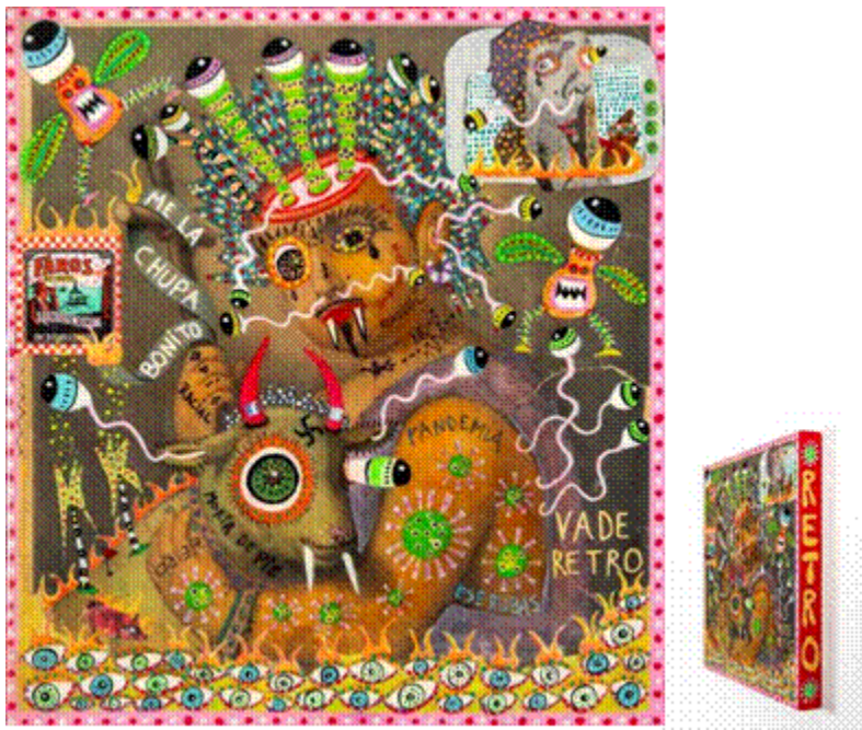
Vade Retro, 2022. Collage, resina líquida y pintura. 36 x 33,5 cm.

una actividad mental puntual, un diálogo íntimo y desquiciante, producto también del hallazgo y el accidente, en este caso intelectual. verdaderas implosiones, epifanías, que propician una subversión de sentido, quiebres