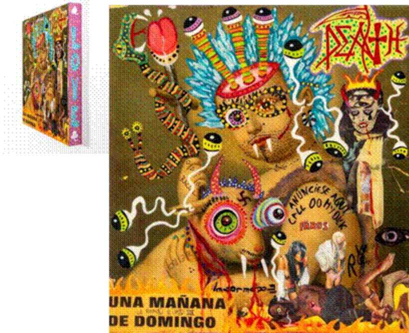
Rubén Bonet, True Love, 2019. Collage, resina líquida y pintura. 40 x 28 cm. Rubén Bonet, Vade Retro, 2022. Collage, resina líquida y pintura. 36 x 33,5 cm.