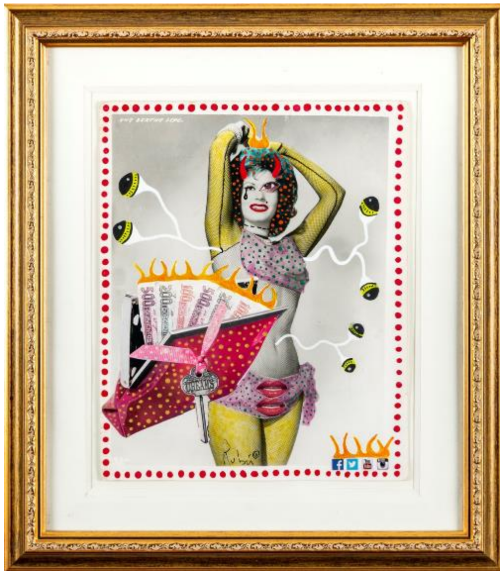
No me quieran, denme dinero, 2014. Fotografía intervenida. 39 x 35 cm.

Rubén Bonet, No me quieran, denme dinero , 2014. Fotografía intervenida. 39 x 35 cm.