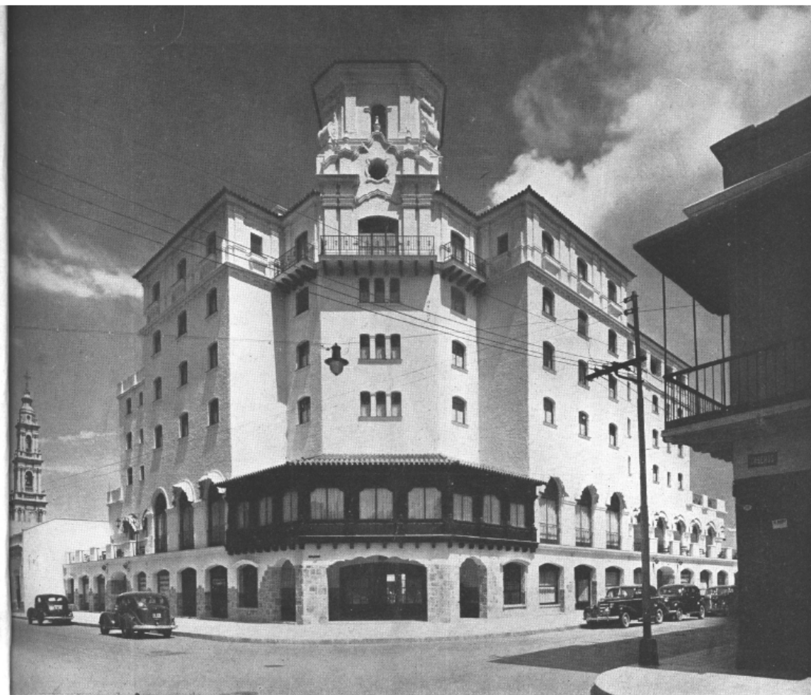
Fachada. — Zócalo de piedra salteña. Balcón cerrado de la ochava, de madera dura; techos de tejas coloniales

septiembre de 1942. Es decir, el GH fue el resultado de creciente interés estatal por regular y promocionar el turismo por parte de los gobiernos conservadores durante los años treinta (Rodríguez Buscia, 2022). Producto de dicho proceso y en el marco de una lógica continuista, la preocupación pública por organizar el turismo adquiriría mayor relevancia durante el periodo peronista. Así pues, el GH rápidamente fue considerado uno de los edificios más emblemáticos de la ciudad y uno de los activos más valiosos de la provincia.[5]