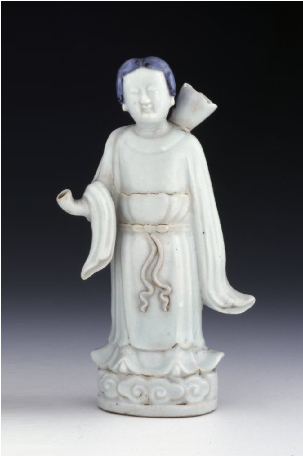
Imagen 8 Aguamanil

Jingdezhen, ca. 1600, The British Museum, Londres. Núm. inv, 1973,0726.380. https://www.britishmuseum.org/collection/object/A_1973-0726-380