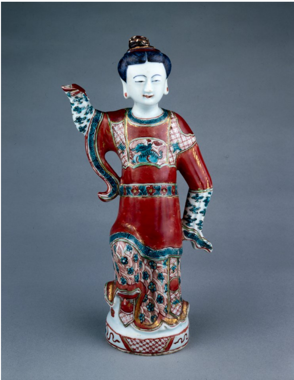
Imagen 9 Aguamanil