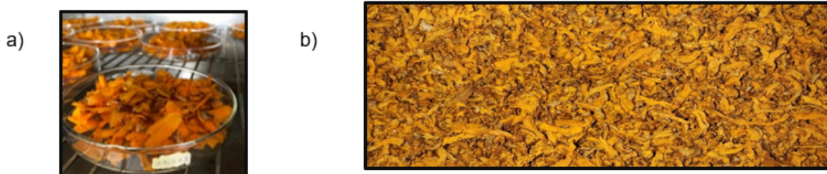
Figura 3. a) Cúrcuma en tiras antes del secado b) Cúrcuma seca

Los rizomas lavados y oreados fueron llevados al rallado en tiras. Después, las tiras fueron sometidas a secado, como fue descrito en la metodología. En la siguiente figura se muestra la cúrcuma antes y después del secado.