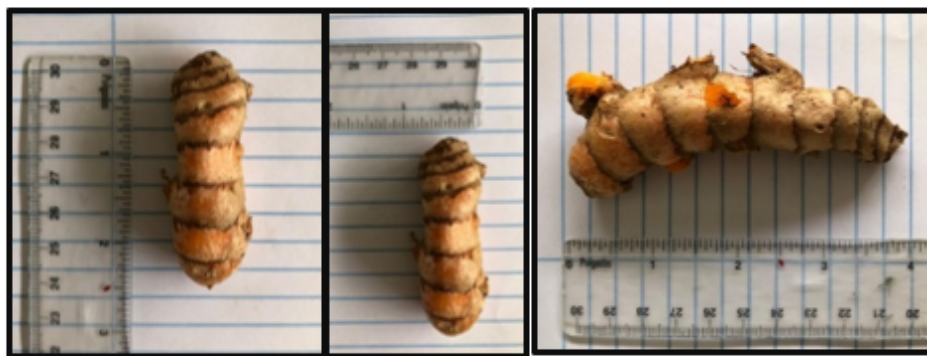
Figura 2. Rizomas de cúrcuma ( Curcuma longa )

La cúrcuma se recibió, se inspeccionó, fue lavada y oreada para ser utilizada en los experimentos. En la Figura 2 se presentan las imágenes de algunos de los rizomas utilizados.