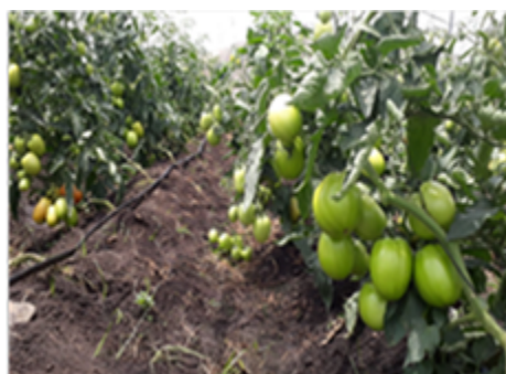
Figura 1: Experimento en etapa de producción, frutos del híbrido Miranda, comunidad Chagüite Grande Jinotega Ciclo primera 2019.

Los parámetros considerados para frutos comerciales fueron, enteros sanos, y exentos de podredumbre o deterioro, limpios, exentos de cualquier materia extraña visible; exenta de plagas, y daños causados por ellas, bien desarrollados con grado de madurez satisfactorio, pulpa suficientemente firme con peso mayor a 70 g y los frutos no comerciales inferiores a 70g.