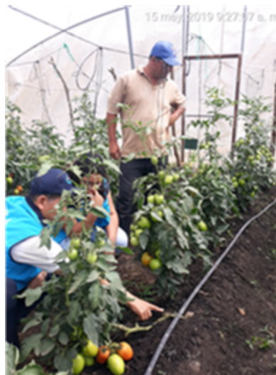
Figura 2: Experimento en etapa de producción, híbrido Tisey, comunidad Chagüite Grande Jinotega Ciclo primera 2019.

Manejo del experimento: Se estableció bajo casa malla y se implementaron prácticas de manejo, tutoro verticales de plantas individuales manejado a una guía, asimismo se realizaron podas de formación y aclareos para el buen desarrollo de las plantas, de igual manera se realizó monitoreo de plagas y enfermedades según la incidencia se realizaron aplicaciones de productos preventivos y selectivos.