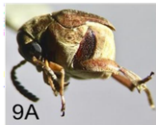
Fig. 9A M. maculiventris (Bruchidae), vista lateral