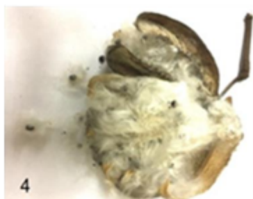
Fig. 4 Fruto seco con semillas sueltas y abundantes fibras blancas que cubren las semillas