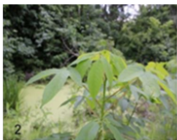
Fig. 2 Hojas del arbusto