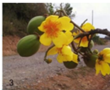
Fig. 3 Fruto verde y flor