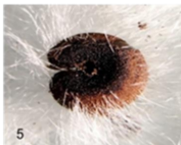
Fig. 5 Semillas secas cubiertas con fibras blancas