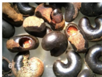
Fig. 6 Abertura de semilla, con y sin cubierta, donde emerge adulto de Megacerus maculiventris