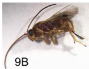
Fig. 9B Stenocorse bruchivora