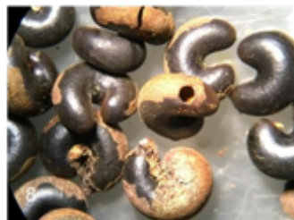
Fig. 8 Abertura, placa chica por donde sale Stenocorse bruchivora (Braconidae)