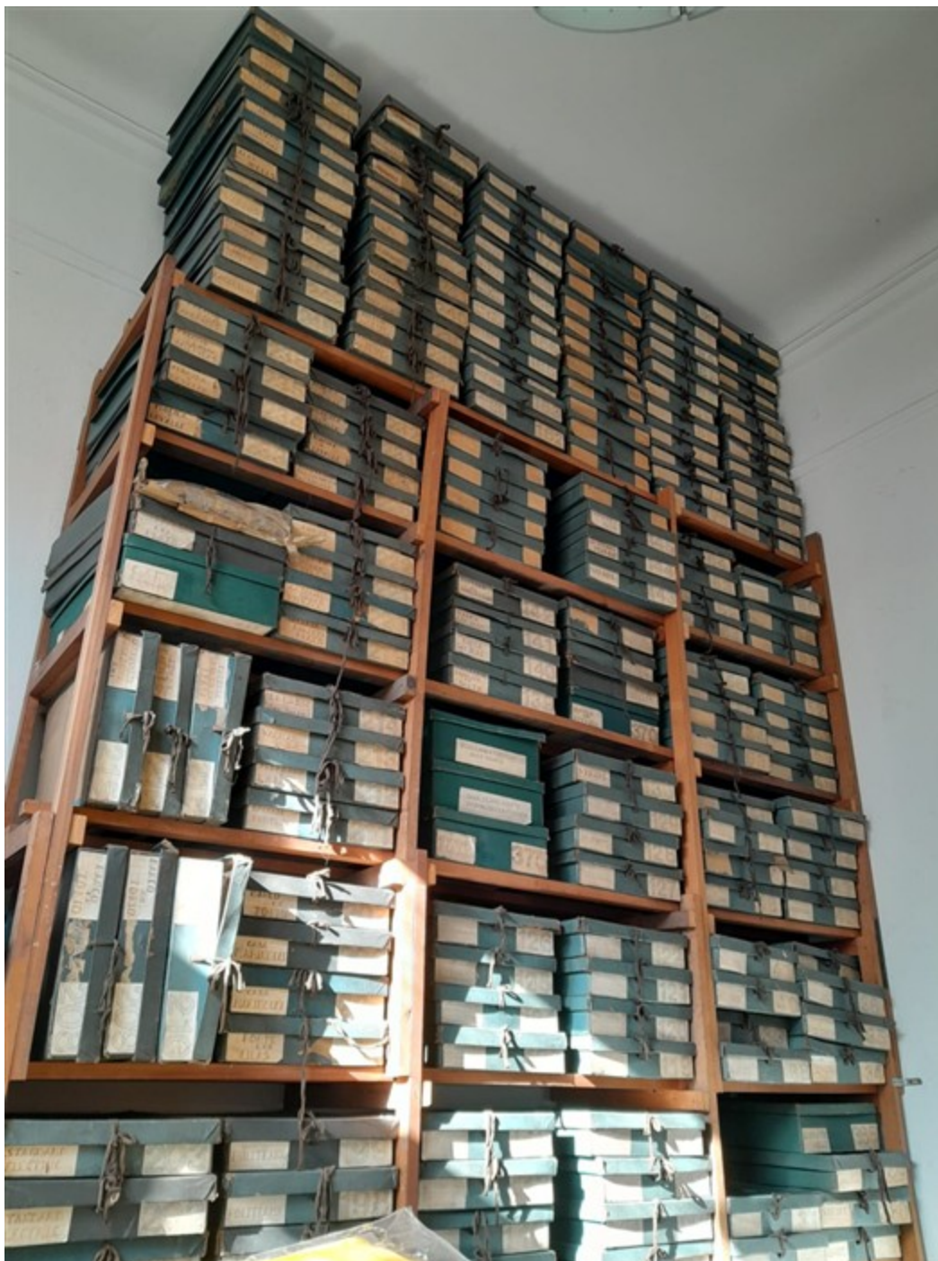
Figura 2. Fondo Estudio Aslan y Ezcurra.