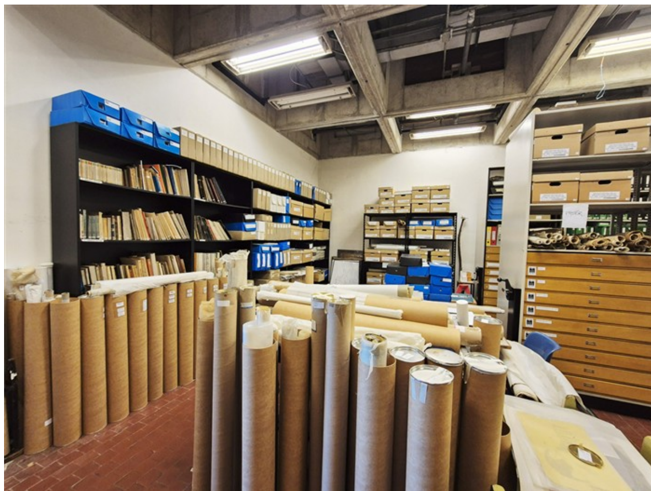
Figura 4. DAR. Vista general del depósito.