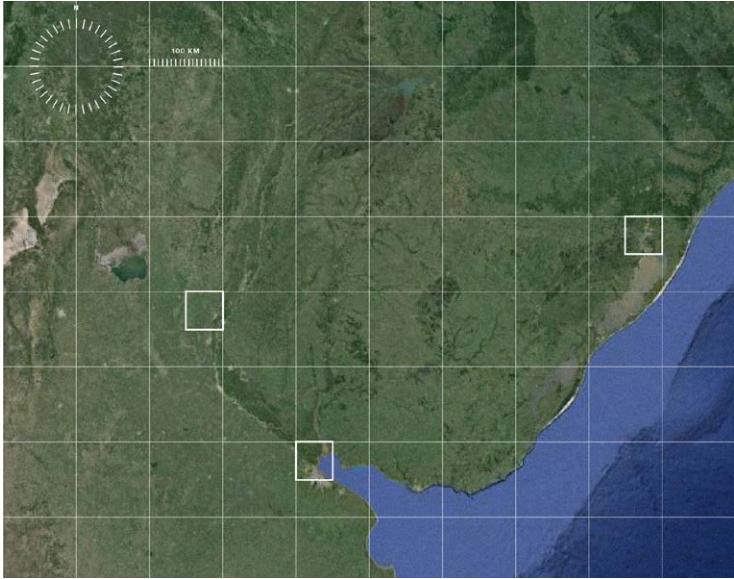
Figura 1. La isla latinoamericana. | Figura 2: Tres sistemas fluviales sudamericanos.

Se caracterizan por la relación aislamiento y conexión, establecida a lo largo de la historia y factor determinante de la vida. Son unidades vulnerables con carácter representativo, imágenes textuales y visuales, condición geocultural, laboratorios donde imaginar comunidades y utopías.