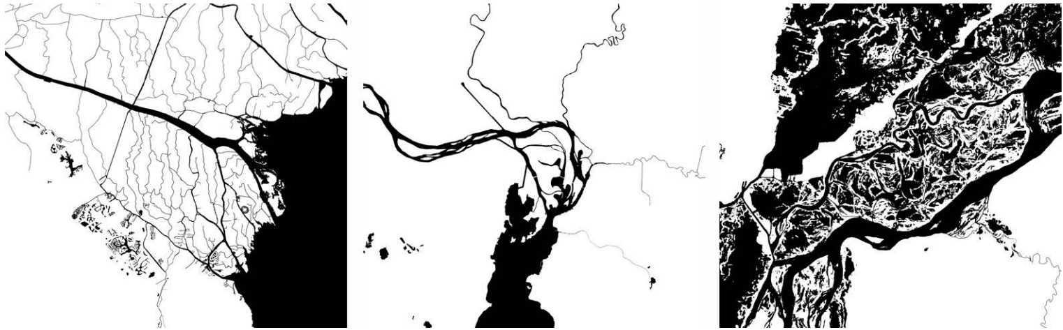
Figura 4. Taxonomía de tierras y aguas en las áreas de Porto Alegre, Tigre (AMBA), Santa Fe (AMSFE) con localización de proyectos de turismo comunitario. Fuente: elaboración Maximiliano Mingo y Nicolás Badaracco.

se han identificado procesos de invisibilización y re-territorialización 14 .