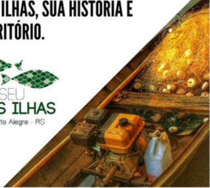
Figura 5: Imágenes de difusión recopiladas de redes sociales.

recorrido los vecinos anfitriones conversan con los visitantes acerca de las tensiones propias de habitar un territorio aislado y las opciones de desarrollo. La experiencia de turismo comunitario fue declarada de interés por el Consejo Municipal de la ciudad de Santa Fe, lleva 12 ediciones y un total de 210 visitantes entre locales y extranjeros. Los casos del turismo comunitario analizados se inscriben en el tipo de turismo de cercanía, oferta próxima a las áreas centrales de aglomerados de Porto Alegre, Tigre (AMBA) y Santa Fe (AMSFE). El atractivo turístico es la singularidad local: el modo particular en que una comunidad se ha relacionado (y entiende) la naturaleza fluvial, el paisaje. El desplazamiento a través o al lado del agua es parte constitutiva de la experiencia. El paisaje insular se experimenta en el recorrido, es la marca (evidenciada en las redes), la imagen del territorio (diferente del continental). En los casos del Museu das ilhas y de La Boca, se trata de iniciativas universitarias (UFRGdS y UNL, respectivamente). En todos los ejemplos, se reconocen procesos de empoderamiento de la población local, articulados en red de actores estatales y organizaciones intermedias. Experiencias de desarrollo desde abajo, con concientización respecto de bienes comunes que configuran la identidad colectiva, valoración de los ecosistemas de fluviales insulares