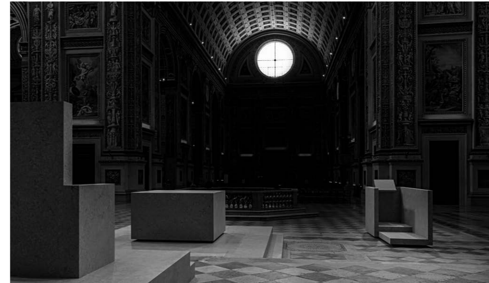
Figura 8. La sala de despedida. Templo de cremación, Parma, 2010. Fuente: Archivo Zermani Associati. Fotógrafo: Mauro Davoli. | Figura 9. Los focos litúrgicos. Reforma arquitectónica de la Basílica de Sant'Andrea, Mantua, 2016. Fuente: Archivo Zermani Associati. Fotógrafo: Mauro Davoli.