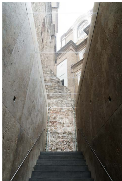
Figura 11. Vista desde arriba. Nueva salida del Museo de las Capillas de los Medici, Florencia, 2023. Fuente: Archivo Zermani Associati. Fotógrafo: Stéphane Giraudeau. | Figura 12. La escalera de salida. Nueva salida del Museo de las Capillas de los Medici, Florencia, 2023. Fuente: Archivo Zermani Associati. Fotógrafo: Stéphane Giraudeau.

esculpiendo el Día, la Noche, el Amanecer y el Crepúsculo. En esta secuencia desarrolló, como nadie antes que él, el tema de la no finitud como prerrogativa de lo moderno, disponiendo las figuras en posturas inestables sobre la cubierta de las tumbas. Es esa suspensión la que el artista mostró en el Prigioni y más tarde, definitivamente, en la Pietà Rondanini .