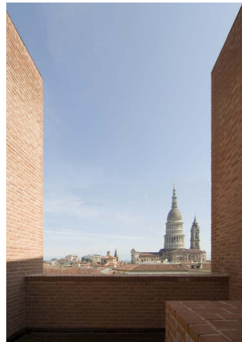
Figura 5. La torre reconstruida. Reconstrucción y restauración del castillo de Novara, 2015. Fuente: Archivo Zermani Associati. Fotógrafo: Mauro Davoli. | Figura 6. Vista desde la torre hacia la torre Antonelli. Reconstrucción y restauración del castillo de Novara, 2015. Fuente: Archivo Zermani Associati. Fotógrafo: Mauro Davoli.

Antes de nuestra intervención, las dos alas este y norte conservaban un carácter definido, coincidentes con las distintas ampliaciones visconteas, mientras que el lado sur estaba ocupado por edificios de servicios en estado de ruina, adheridos a las fortificaciones almenadas, y el lado occidental estaba completamente derribado, a excepción de un fragmento aislado de la época medieval. Las excavaciones realizadas permitieron identificar, precisamente en este lado, el antiguo trazado original de origen romano, situado exactamente en la dirección donde permanece el fragmento medieval en alzado. En el interior de la excavación, junto a los muros, se encontraron decenas de restos humanos, niños, soldados, enterrados junto con las ruinas.