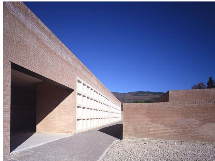
Figura 1. La pared exterior. Cementerio de Sansepolcro, 1997-2000. | Figura 2. Los patios interiores. Cementerio de Sansepolcro, 1997-2000.

el Museo Cívico de la ciudad, Cristo resucita sobre el fondo del valle del Tíber, elevándose desde la base formada por la tumba abierta: base de la tumba, colina y cielo son los tres elementos de la composición. El Cristo de Piero no resucita de manera enfática ni estática. A través de su propio cuerpo, ya sacrificado por el hombre, parece consciente de cuánto queda por hacer y permanece vinculado a la tierra.