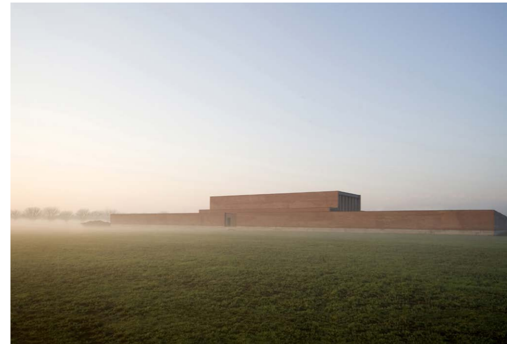
Figura 7. Vista desde los campos. Templo de cremación, Parma, 2010.

En el interior, partes de las murallas visconteas, elevadas sobre los muros romanos, emergen del pavimento de la planta baja, en la sala principal de la galería, mientras que el muro medieval y la torre de la esquina al suroeste, de época romana, permanecen completamente visibles, desde los cimientos hasta la cornisa. Las cotas de excavación permiten que gran parte de la misma y de las estructuras encontradas sean utilizables y visibles. La fachada que da al patio interior está deliberadamente inacabada, incorporando, en su consistencia