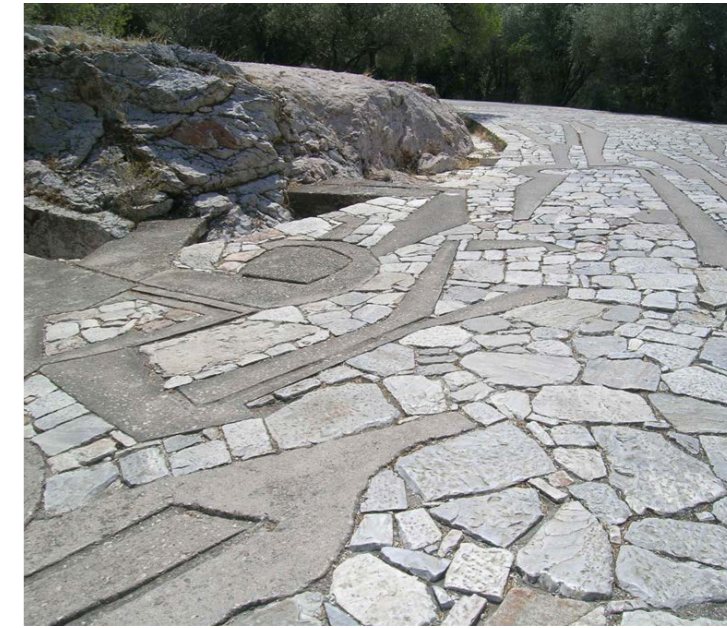
Figuras 1 y 2. Adecuación para el acceso a la Acrópolis de Atenas, Arq. Dimitris Pikionis.

Aquellos antepasados nuestros tenían una profunda conciencia de lo incomparable que era esta tierra y sintieron que habían cumplido su deuda con ella. Tagore dice, respecto a la India, que “pagó a la madre naturaleza con devoción y amor”: estas palabras se adaptan perfectamente a los antiguos habitantes de esta tierra nuestra. Así canta Eurípides: