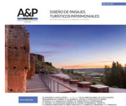
Imagen de tapa : Teatro romano de Clunia. Anticuario. Vista del paisaje desde la galería trasera de la escena.

ISSN 2362-6089 (Impresa) ISSN 2362-6097 (En línea)