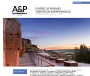
Imagen de tapa : Teatro romano de Clunia. Anticuario. Vista del paisaje desde la galería trasera de la escena.

ISSN 2362-6089 (Impresa) ISSN 2362-6097 (En línea)