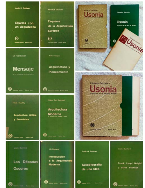
Figura 3. La Biblioteca de Arquitectura. Elaboración propia a partir de los libros revisados en la Biblioteca de la Editorial Infinito, en la Biblioteca Nacional y en la Biblioteca FAU UNLP.

La operación de marcado en este caso es evidente: Infinito reunió obras de diversas procedencias en una biblioteca con el mismo diseño de cubierta verde y con el mismo formato de 15 por 23 centímetros, lo que implica una imposición simbólica externa al texto en sí (Fig. 3). Los libros, al igual que en la colección ya comentada, fueron accesibles: todos valían, según el catálogo de 1961, entre 130 y 330 pesos, a excepción del de Pevsner que era mucho más largo (350 páginas) (550 pesos), y el de Sacriste (420 pesos), que contó con dos partes: el libro propiamente dicho y un sobre con la documentación de las obras a modo de apoyo gráfico, ambos dentro de una caja. La Biblioteca de Planeamiento y Vivienda fue creada por Jorge Enrique Hardoy y contaba con seis títulos hacia el final del recorte temporal que aquí trabajamos: La ciudad es su población de Henry Churchill (1958), La metrópoli en la vida moderna en cuatro tomos de Richard Neutra, Donald Young, Joseph Folliet y otros (1958), Planeamiento urbano de Thomas Sharp (1959), Cómo concebir el urbanismo de Le Corbusier (1959), Ciudades en evolución de Patrick Geddes (1960) y La ciudad del futuro de Le Corbusier (1962) (Catálogo Ediciones Infinito, 1966). La biblioteca es un reflejo del debate que estaba atravesando la disciplina urbanística a mediados