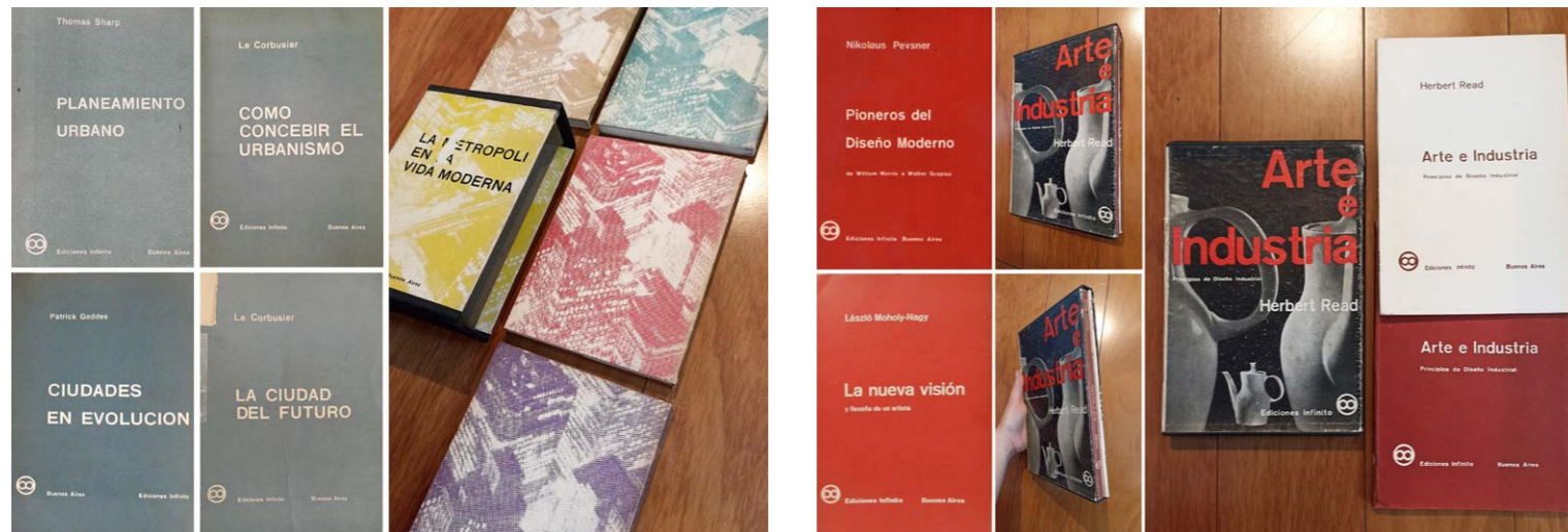
Figura 4. La Biblioteca de Planeamiento y Vivienda. Elaboración propia a partir de los libros revisados en la Biblioteca de la Editorial Infinito, en la Biblioteca Nacional y en la Biblioteca FAU UNLP. | Figura 5. La Biblioteca de Diseño y Artes Visuales. Elaboración propia a partir de los libros revisados en la Biblioteca de la Editorial Infinito, en la Biblioteca Nacional y en la Biblioteca FAU UNLP.

Pastor, y contaba hacia 1964 con tres títulos publicados y dos en prensa: Pioneros del diseño moderno de Nikolaus Pevsner (1958), La Nueva Visión de László Moholy-Nagy (1963), Arte e industria de Herbert Read (1961), Los problemas del Arte de Susanne K. Langer (recién publicado en 1966) y El cine como arte de Rudolph Arnheim (publicado en 1971) (Catálogo Ediciones Infinito, 1966). Estas publicaciones deben entenderse como factor y resultado del florecimiento del campo del diseño en Argentina surgido del devenir de, por un lado, el arte concreto –es decir, de la particular crítica rioplatense a la concepción decimonónica del arte– y, por otro, de la arquitectura moderna, lo que explica que estas traducciones pioneras sean justamente de arquitectos 8 . La biblioteca fue la base para la materia Visión (originalmente surgida en la Universidad Nacional del Litoral y luego llevada a la Universidad de Buenos Aires) inspirada en la forma de trabajo de la Bauhaus. Nuevamente se reproduce el recurso de unificar formatos y portadas, esta vez de 13 por 20 centímetros y color azul claro en el caso de la Biblioteca de Planeamiento, y de 15 por 23 centímetros y color naranja en la Biblioteca de Diseño (Fig. 4 y 5). Las obras de estas colecciones tenían un precio de entre 220 y 470 pesos,