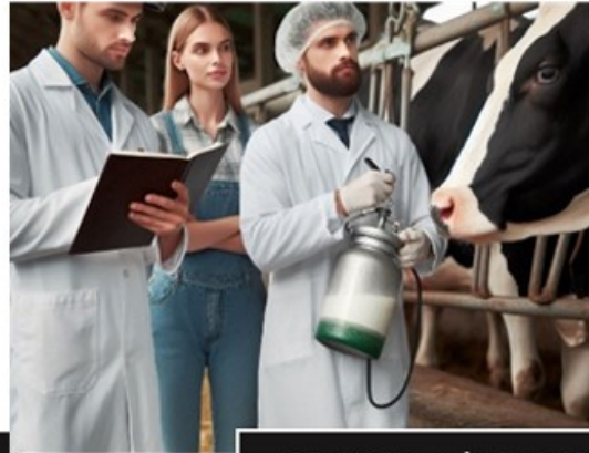
2ª Visita a la propiedad