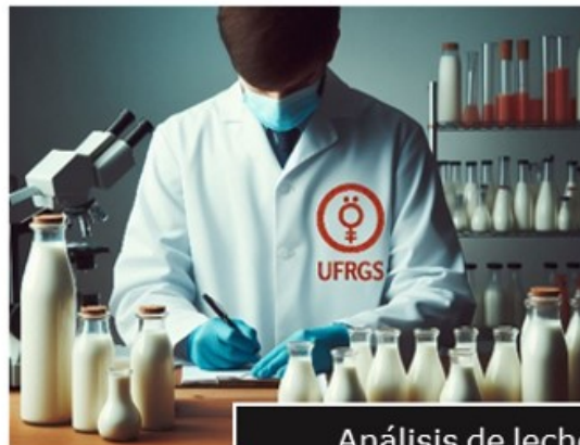
Análisis de leche