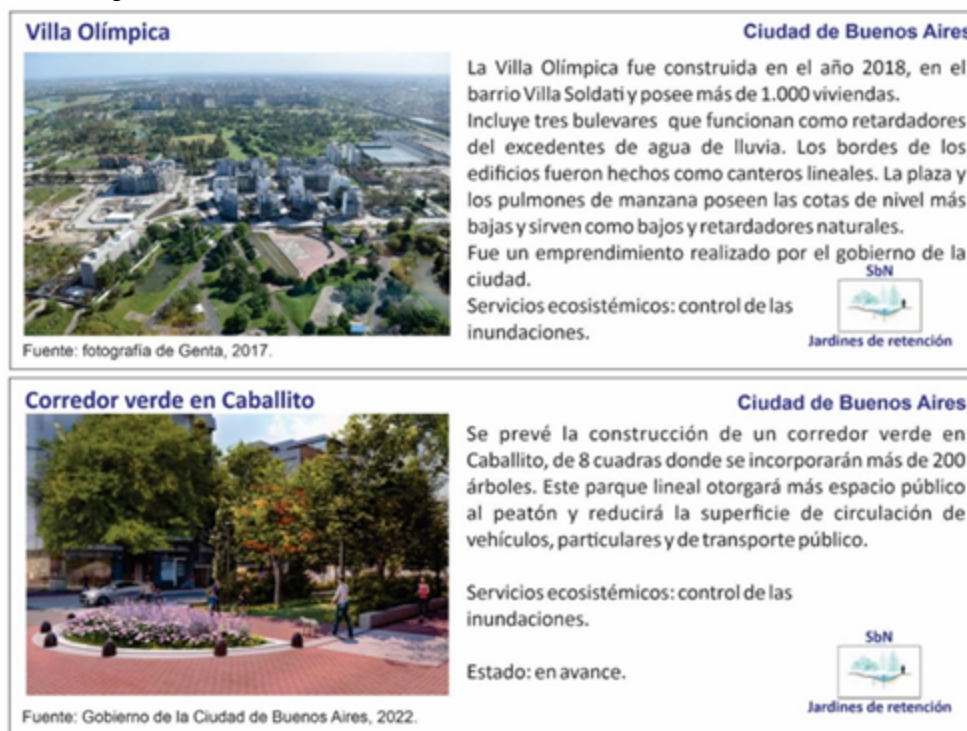
Figura 3 Algunas Soluciones basadas en la Naturaleza en la Ciudad de Buenos Aires

Otro ejemplo de ampliación de la cubierta verde es la Villa Olímpica, construida en el año 2018 (Figura 3). Fue creada para los Juegos Olímpicos de la Juventud de Buenos Aires de ese mismo año y está localizada en el barrio de Villa Soldati. Incluye tres bulevares principales que funcionan como retardadores del excedente de agua de lluvia, al igual que los bordes de los edificios. La Plaza del Encuentro y los corazones de manzana poseen las cotas de nivel más bajas y sirven como bajos. Este sistema de jardines de retención garantiza un paisaje resiliente a las inundaciones (Gobierno de la Ciudad de Buenos Aires, 2019).