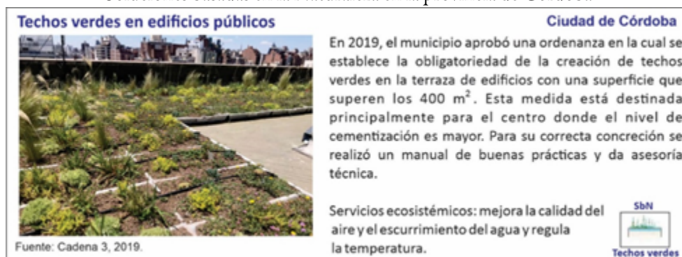
Figura 5 Soluciones basadas en la Naturaleza en la provincia de Córdoba