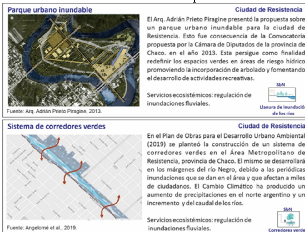
Figura 8 Soluciones basadas en la Naturaleza en la provincia de Chaco

En la provincia de Chaco, se prevé la construcción de un corredor verde en el Área Metropolitana de Resistencia. Estará vinculado a la creación de nuevos espacios verdes y la renovación de los ya existentes, en los alrededores del río Negro. Tiene como finalidad revertir la fragmentación espacial del área metropolitana y preservar los recursos ambientales (Angelomé, Angelomé y Cicchelli, 2019). Por otra parte, también se propuso la creación de un parque urbano inundable (Figura 8). Esta idea surgió en el año 2013 como producto de una convocatoria impulsada por la Cámara de Diputados de la provincia para su proyección sobre las márgenes del Río Negro (Cabezas, 2013).