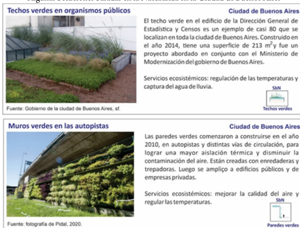
Figura 2 Algunas Soluciones basadas en la Naturaleza en la Ciudad de Buenos Aires

En el año 2012 se creó la Ley 4428 sobre la construcción y mantenimiento de las cubiertas verdes (Figura 2). En la misma se planteaba que las nuevas obras que se realicen en la ciudad tendrían una reducción en el pago de impuestos sobre la construcción si incluían la creación de una o más cubiertas vegetales (Legislatura de la Ciudad Autónoma de Buenos Aires, 2012). Esto se extiende también a aquellos propietarios de edificaciones que implementen y mantengan techos verdes, quienes gozarían de una reducción en el importe del Alumbrado, Barrido y Limpieza. Posteriormente, en Código de Edificación del año 2018 se retoman las cubiertas o techos verdes definiendo las características y materiales que deben incluir (Boletín Oficial de la Ciudad de Buenos Aires, 2018).