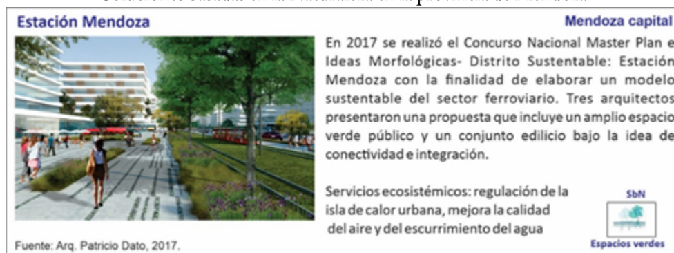
Figura 7 Soluciones basadas en la Naturaleza en la provincia de Mendoza