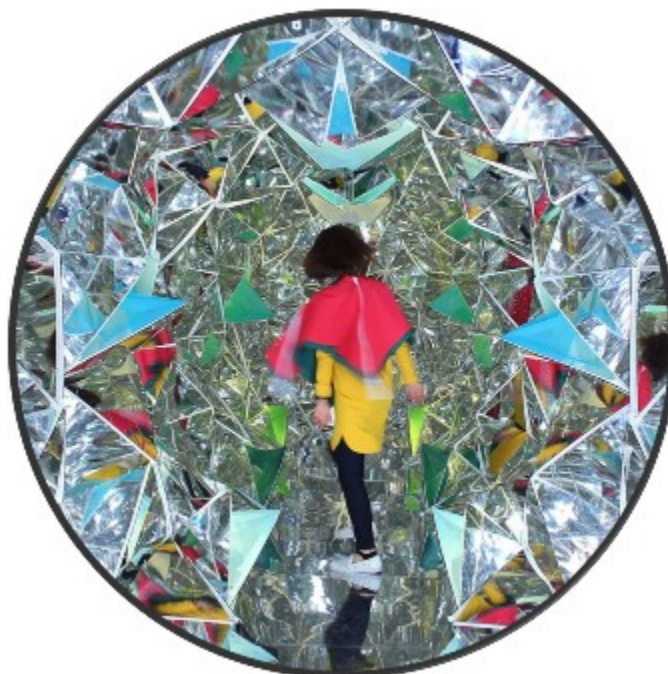
Figura 1 Kaleidoscope.

Masakazu Shirane y Saya Miyasaki (2014). Recuperado de https://images.adsttc.com/media/images/53da/99f7/c07a/80d9/7100/03d1/large_jpg/wink-space-kaleidoscope-masakazu-shirane-saya-miyasaki-2.jpg