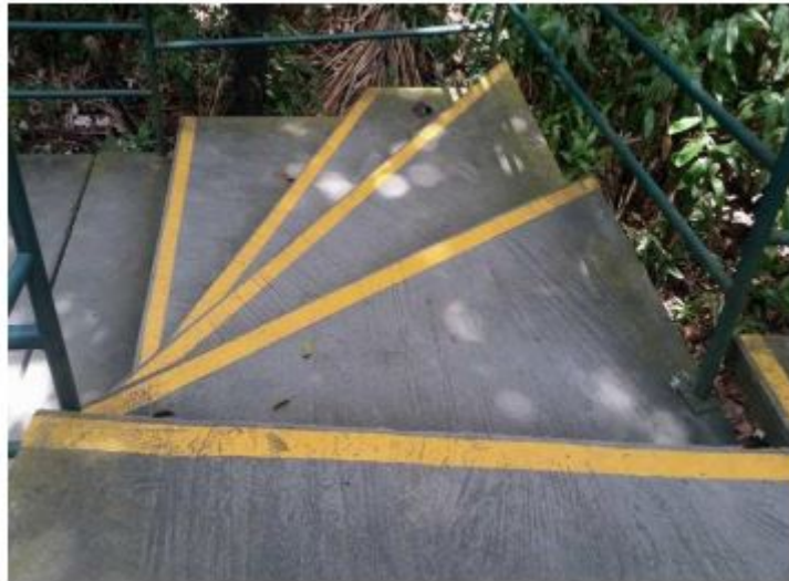
FIGURA 7 Trilha suspensa