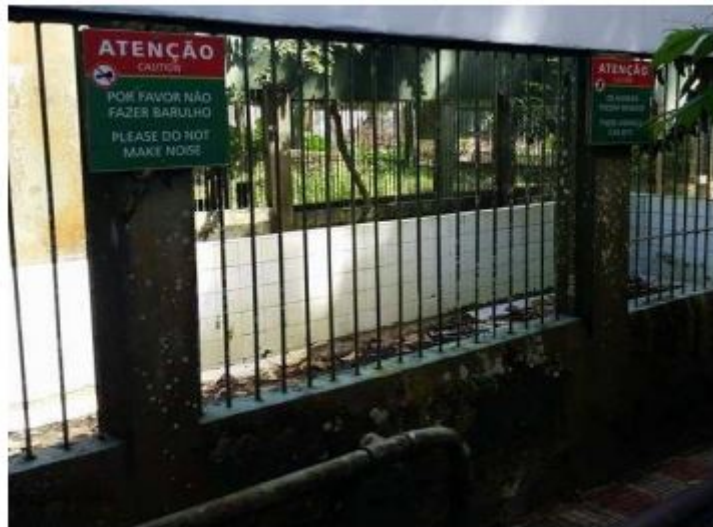
FIGURA 3 Tanque das Ariranhas