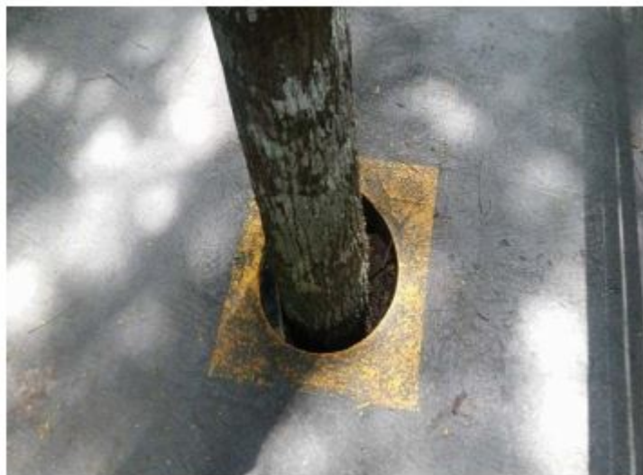
FIGURA 8 Trilha suspensa

Outro espaço que consideramos relevante é a Casa da Ciência. Neste local, a fachada do prédio apresenta o formato de figuras geométricas planas. Para o ensino esse local apresenta inúmeras possibilidades, como por exemplo, iniciar o processo de ensino, como também, finalizar o aprendizado por apresentar múltiplas formas. Dentro deste espaço inúmeros objetos contextualizam o saber geométrico espacial.