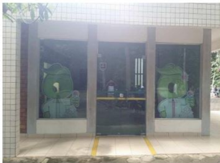
FIGURA 9 Casa da Ciência