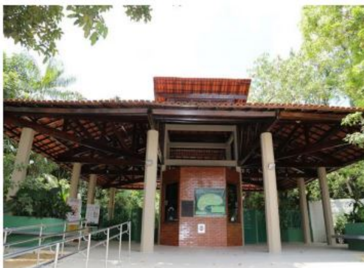
FIGURA 2 Bilheteria