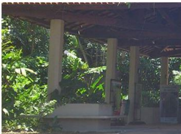
FIGURA 1 Praça