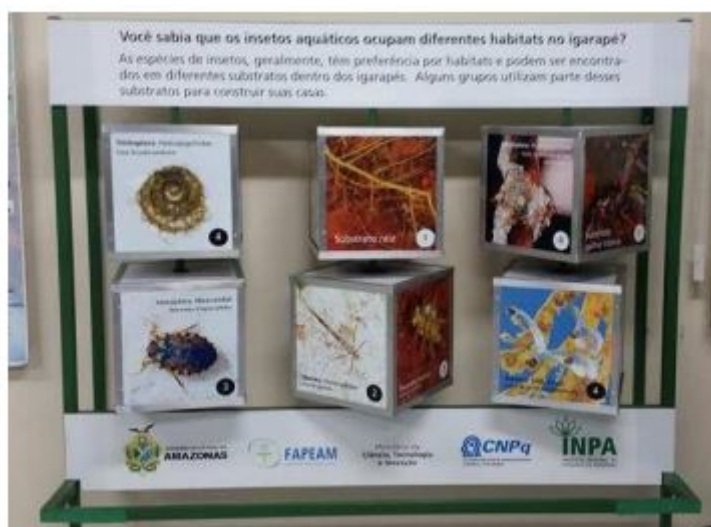
FIGURA 10 Casa da Ciência