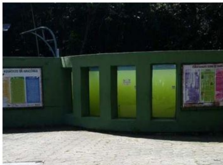
FIGURA 4 Tanque do peixe-boi