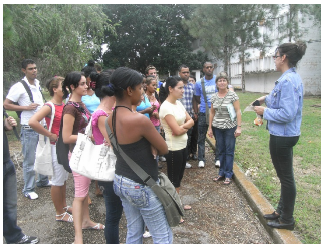
FIGURA 4 Estudiantes universitarios de la Carrera Ingeniería Química en visita guiada en el Jardín Botánico de Matanzas.

El resultado acerca de las visitas guiadas que se contabilizó en 688 estudiantes de primaria, 303 de secundaria básica y 600 universitarios, en los diferentes cursos ha sido un logro del jardín botánico de Matanzas, a partir de que la atención a las visitas era la responsabilidad de estudiantes del grupo científico del jardín. En los últimos años se elevaron las visitas en un 50 % con la presencia de un especialista en educación ambiental potenciándose la atención hacia los estudiantes universitarios. (Figura 5).