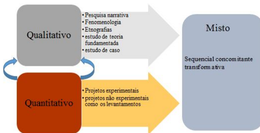
FIGURA 2 Fluxograma da inter-relação das estratégias de investigação.

Ao discutir a natureza das abordagens de investigação faz-se necessário apresentar uma visão dessas estratégias de investigação. Creswell (2010) chama atenção para o fato de que na perspectiva qualitativa o ambiente natural é a fonte direta de dados e o pesquisador o principal instrumento, sendo que os dados coletados são predominantemente descritivos. Já no método quantitativo busca testar teorias objetivas examinando a relação entre as variáveis para que os dados numéricos possam ser analisados por procedimentos estatísticos. O método misto é uma abordagem da investigação que combina ou associa as formas qualitativas e quantitativas em um único estudo, essas definições têm consideráveis informações em cada uma dela.