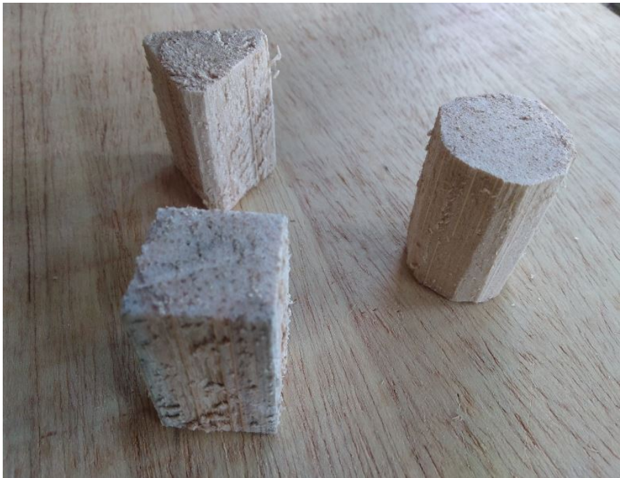
FIGURA 4 formas tridimensionais construídas com a bucha do buriti antes e depois de lixadas