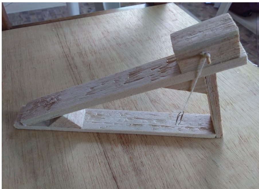
FIGURA 2 maquete do plano inclinado feita com a bucha do buriti