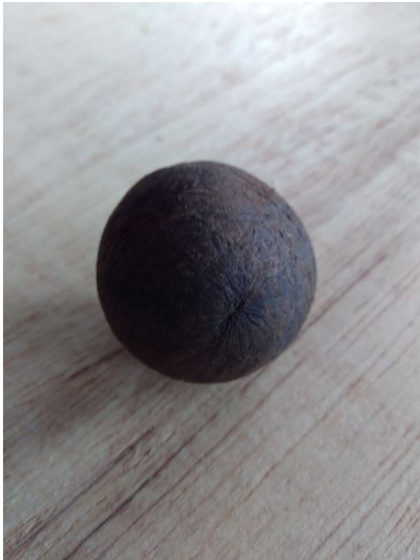
FIGURA 1 caroço de tucumã usado como analogia de uma esfera