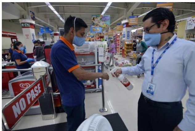
Figura 2. Manejo del COVID-19 en el contexto laboral

público y privado. El segundo documento (23 de abril del 2020) actualiza al anterior, titulado “ Guía orientativa de retorno al trabajo frente a COVID-19. Protocolo de protección y prevención laboral de los trabajadores y trabajadoras para recuperar la actividad industrial ” [6], tiene como objetivo ofrecer a las empresas un amplio número de directrices de actuación para el retorno a las actividades laborales (Fig. 2).