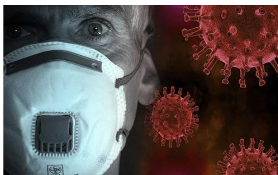
Figura 1. Representación gráfica del COVID 19

El desconocimiento real del número de casos (personas sintomáticas, presintomáticas y asintomáticas) y la incidencia de infección viral, al igual que sucede en la gran mayoría de países, supone un importante problema epidemiológico que limita la toma de decisiones en su conjunto. No obstante, el Centers for Disease Control (CDC) estima un R_0=5.7 de contagiosidad, es decir, 1 persona con la COVID-19 puede contagiar de 5 a 6 personas más [4], por tanto, algo ya sabemos (Fig 1).