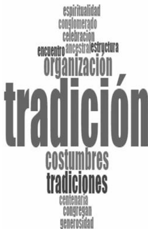
FIGURA 2. Nube de palabras “¿Qué es una cofradía?”

Según la percepción de los participantes de la investigación, las cofradías son consideradas como tradiciones del pueblo que se transmiten de generación en generación. La nube de palabras revela que tradición es el concepto que se repite con mayor frecuencia al hablar de cofradías, seguido por organización y costumbres.