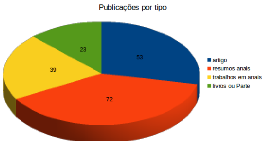
Figura 2 Tipologia das Publicações dos Bibliotecários do IFSP.

Através do levantamento das produções bibliográficas pode-se verificar, de acordo com o Quadro 2, que 74,6% dos entrevistados possui currículo na plataforma lattes, percentual relevante, embora seja salutar o estímulo aos demais profissionais a que realizem o cadastro na plataforma.