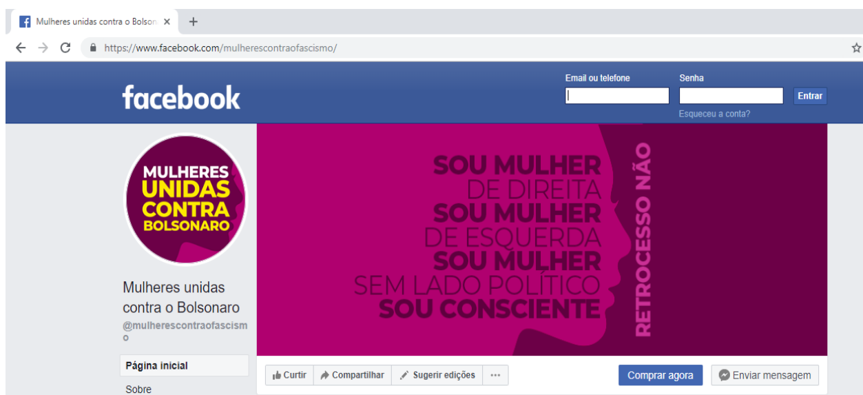
Imagem 1: Página de abertura da página “Mulheres Unidas contra Bolsonaro”

Como iniciativa de ciberativismo feminino contrária a candidatura de Jair Bolsonaro, surgiu, em agosto de 2018, na rede social Facebook o Movimento “Mulheres Unidas Contra Bolsonaro” (PINHEIRO-MACHADO; BURIGO, 2018), que através de uma campanha, denominada #EleNão publicava mensagens contra o candidato Jair Bolsonaro, do PSL, que eram compartilhadas nas redes sociais digitais. Segundo um estudo realizado pelo Laboratório de Estudos sobre Imagem e Cibercultura da Universidade Federal do Espírito Santo (UFES), em setembro de 2018, às hashtags contra o candidato Jair Bolsonaro - #elenão, #elenunca, #elejamais; #mulherescontrabolsonaro; #mucbvive - atingiram 1 milhão de participantes (BECKER, 2018).