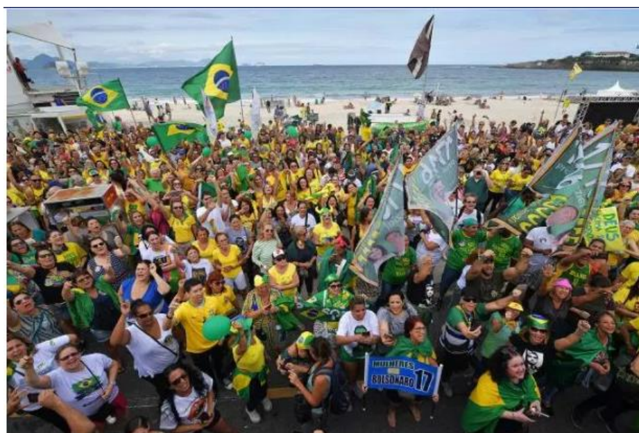
Apoiadores de Jair Bolsonaro realizam ato na praia de Copacabana, no Rio de Janeiro

Imagem 4: Foto e legenda publicadas no site da Revista Veja da manifestação a favor de Bolsonaro