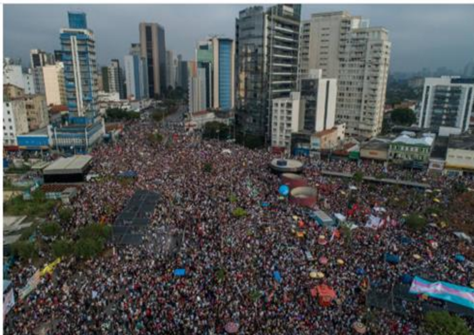
Ato contra o candidato a Presidência do PSL, Jair Bolsonaro, no largo da Batata, em São Paulo, neste sábado (29)

Imagem 3: Foto e legenda publicadas no site do Jornal Folha de São Paulo da manifestação contra Bolsonaro