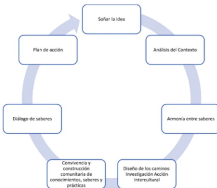
FIGURA 4: La investigación propia modelo de URACCAN

La investigación propia es un proceso que conlleva a desarrollar varios momentos que tejen y articulan la construcción colectiva de la idea, visión y creación, recreación de conocimientos, saberes y prácticas (RUIICAY, 2015):