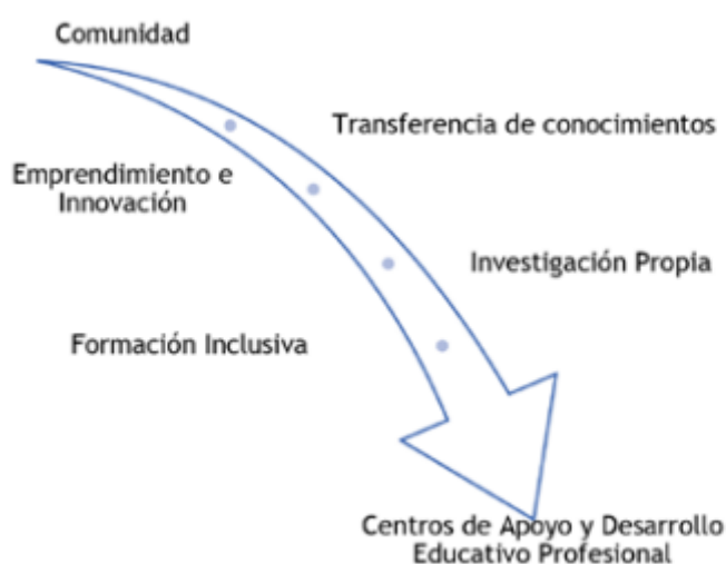
FIGURA 5: Transferencia de conocimientos, saberes y prácticas

El Centro de Apoyo y Desarrollo Educativo Profesional se caracteriza por el fomento, fortalecimiento, y transferencia de buenas prácticas que apoyan, cultivan, adaptan, comunican, innovan y acogen a la comunidad universitaria.