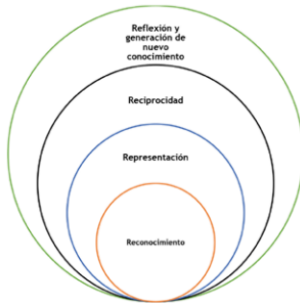
FIGURA 2: Trascendencia de la Investigación en los CADEP