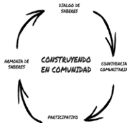
FIGURA 3: Características de la Investigación en los CADEP

La investigación propia es un proceso que conlleva a desarrollar varios momentos que tejen y articulan la construcción colectiva de la idea, visión y creación, recreación de conocimientos, saberes y prácticas (RUIICAY, 2015):