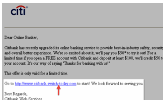
Fig. 2. Mensaje de confianza con sitio falso [31].

Eludir el acceso desde gráficos: Los logos, diseños, gráficos y textos de la página pueden dar acceso a ataques phishing, haciendo creer al usuario que el sitio es completamente legítimo al tener una apariencia similar en su interfaz gráfica, por tal razón se debe eludir el acceso desde gráficos. Ya que todos estos aspectos pueden ser duplicados por el atacante [30].