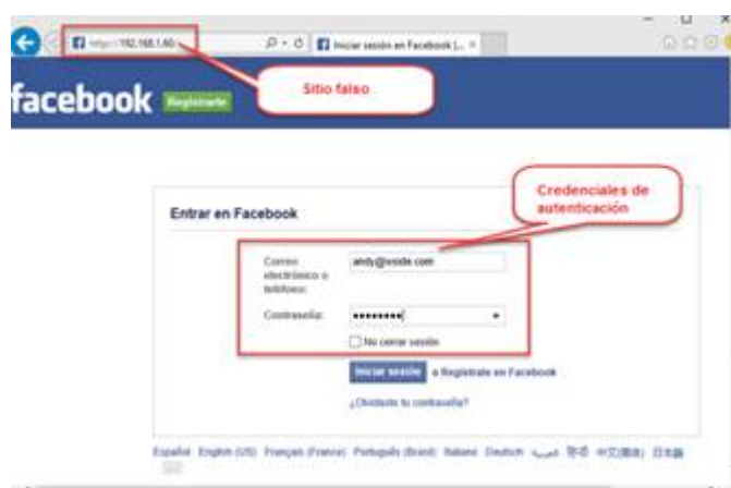
Fig. 3. Phishing en credenciales de autenticación de red social.

Al ingresar a un sitio web el usuario debe cerciorarse teniendo atención y cuidado visual que el dominio (nombre del sitio web) corresponde al legítimo, por ejemplo: www.facebook.com, www.outlook.com. Es necesario validar en detalle el nombre del dominio, pues como se mencionó antes pueden ser modificados en algún carácter y recibir un ataque de phishing [20], ya que los atacantes pueden cambiar algunas letras y hacer que el sitio tenga una semejanza al legítimo, Por ejemplo: www.outlok.com (sin doble 'o'). www.my-facebook.com (con 'my-') o simplemente se puede mostrar la dirección IP como se muestra en la Fig. 3. Los atacantes aprovechan cualquier descuido de los usuarios en la premura y agilidad de realizar diferentes procesos en el trabajo o en sus actividades que se realizan en modo multitarea (varias tareas al mismo tiempo).