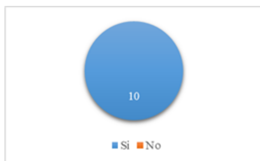
Fig. 12. Pregunta 6.

¿Considera que la técnica agrupa los procedimientos necesarios para proteger las credenciales?