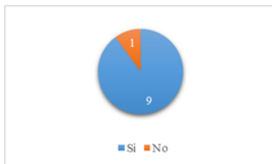
Fig. 11. Pregunta 5.

Se proporciona la técnica físicamente como guía para seguir los procedimientos. ¿Cree que esta técnica le ayuda a recordar fácilmente la prevención ante phishing?