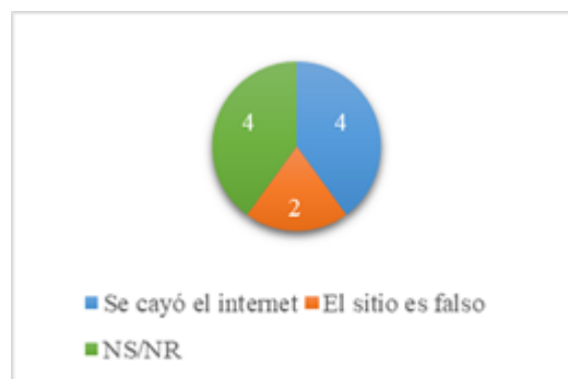
Fig. 9. Pregunta 3.

¿Por qué cree que no inició sesión en el primer intento?