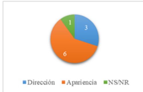
Fig. 8. Pregunta 2.

¿Qué tiene en cuenta a la hora de validar si un sitio es legítimo?