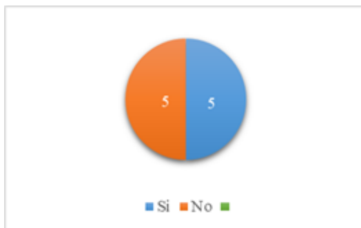
Fig. 10. Pregunta 4.