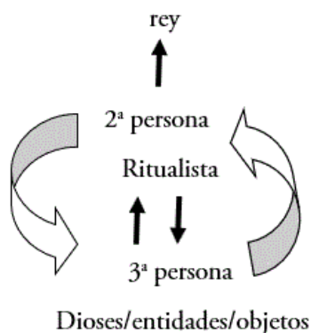
FIGURA 2 Relación entre las segundas y terceras personas en TP 222.

El ritualista establece una relación diádica en la que una de las partes de la liturgia, los cesionarios, otorga a la otra, el beneficiario, las condiciones para su renovación. De este modo, el sacerdote delegado opera como el vehículo de la transferencia que se dirige a los cesionarios en tercera persona y al beneficiario en segunda persona (Fig. 2).