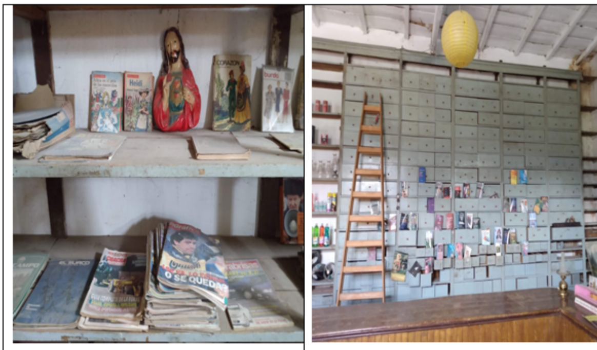
FIGURA 2 Interior del único almacén de ramos generales y pulpería de Quiñihual