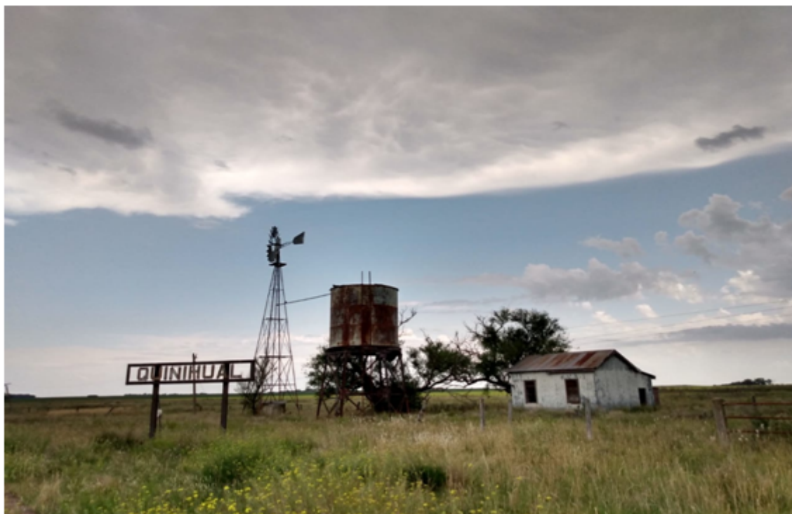
FIGURA 1. Estación Quiñihual, Partido de Coronel Suárez.