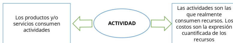
FIGURA 2. Fundamentos del sistema ABC

El ABC basa su filosofía propiamente en que las actividades consumen recursos y que los productos o servicios consumen actividades (Cooper y Kaplan, 1988), permitiendo relacionar el costo de las actividades con cualquier objetivo de costo (figura 2).