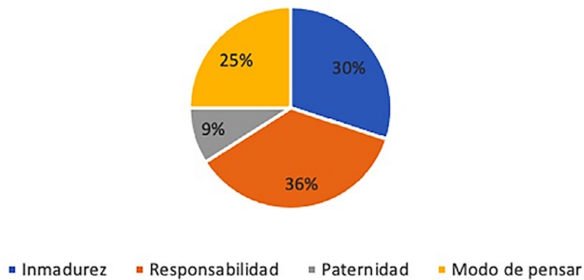
Figura 1 Diferencias percibidas por los entrevistados entre la noción de joven y de adulto