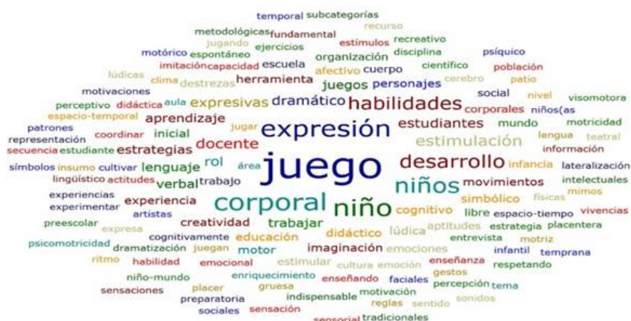
FIGURA 3 Nube de palabras Entrevista a docentes

Una vez interpretada la información obtenida se determinó que las docentes desconocen del tema juego y su incidencia en la expresión corporal, ya que pudieron responder acerca del juego, pero no como medio para estimular las habilidades expresivas y por ende desconocen la importancia y el beneficio que aporta en el desarrollo integral de los niños en su primera etapa.