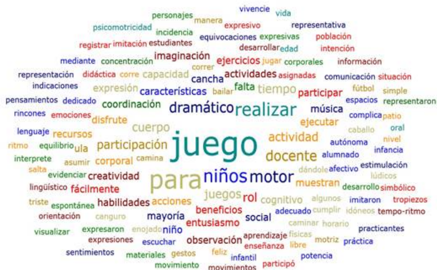
FIGURA 1 Nube de palabras: Ficha de observación Extraído de Atlas Ti. 9