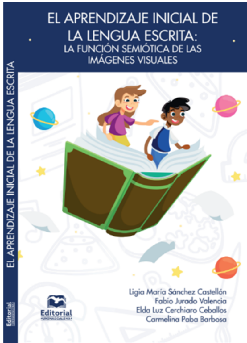
Fig 9 Libro

“Práctica Pedagógica y Lengua Escrita: una búsqueda de sentido”. Revista folios N° 37 primer semestre (2013) pp. 17-25. Universidad Pedagógica, Bogotá. ISSN: 0123-4870.