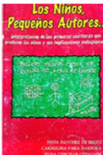
Fig 7 Libro

desafíos, que a través de la gestión de Carmelina se pudieron sortear: pocas herramientas tecnológicas y de comunicación para el desarrollo y seguimiento al proyecto con participantes como maestros de transición, primaria, secundaria, media, aulas multigrado, ubicados en el departamento del Magdalena, resistencias actitudinales frente a las exigencias escriturales para llevar bitácoras, diarios de campo o registros de las prácticas de aula, extrañamiento de los participantes para asumirse como docentes investigadores reflexivos a partir de sus propias prácticas pedagógicas, como una alternativa para generar procesos de formación de maestros. Las expectativas de los docentes estaban más apegadas a las prácticas de ‘capacitación’ tradicionales, pocas investigativas. Finalmente, muchas voces encontradas desde las instancias cofinanciadoras.