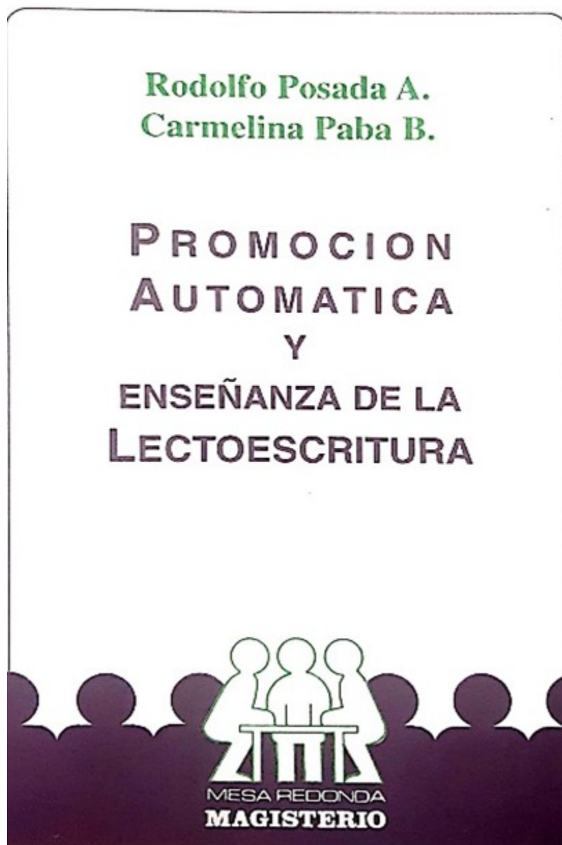
Fig 3 Publicación

Se ha caracterizado siempre por su espontaneidad y sensibilidad. No es extraño que de un momento a otro derrame una lágrima cuando algo toca sus fibras, la conmueve o la afecta positiva o negativamente. Entonces se emociona. En ese marco se trae nuevamente a la memoria otra dicente estrofa de la escritora María Helena Walsh: