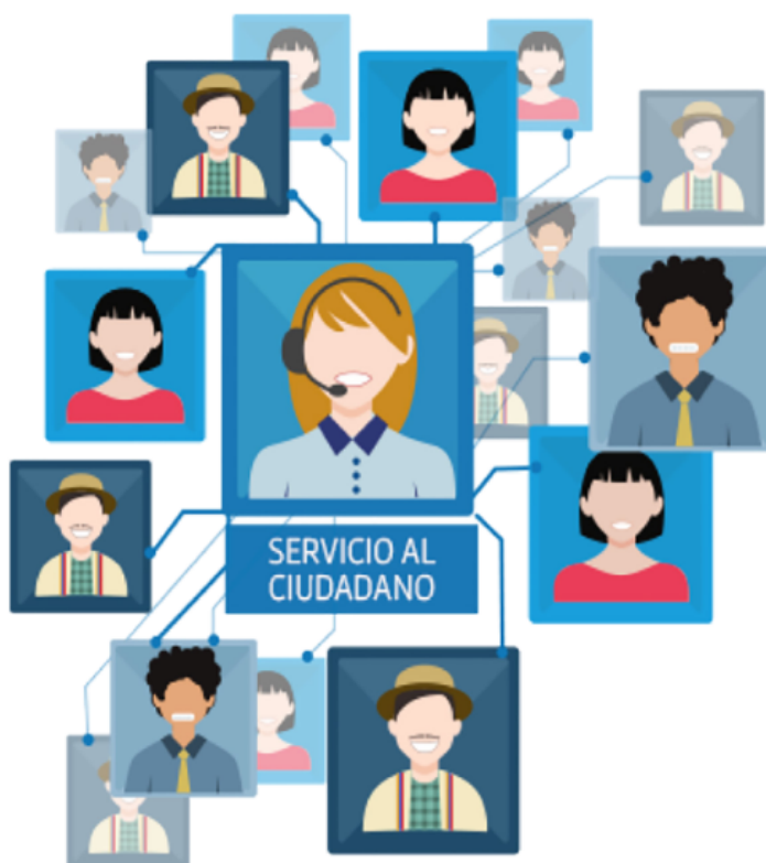
Fig. 3. Servicio al ciudadano. [24].