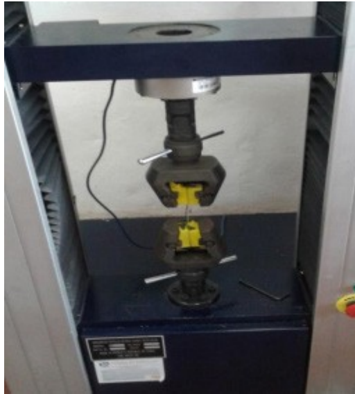
Figura 1. Ensayo a tracción directa de fibra por medio de maquina universal MTS. Elaboración propia