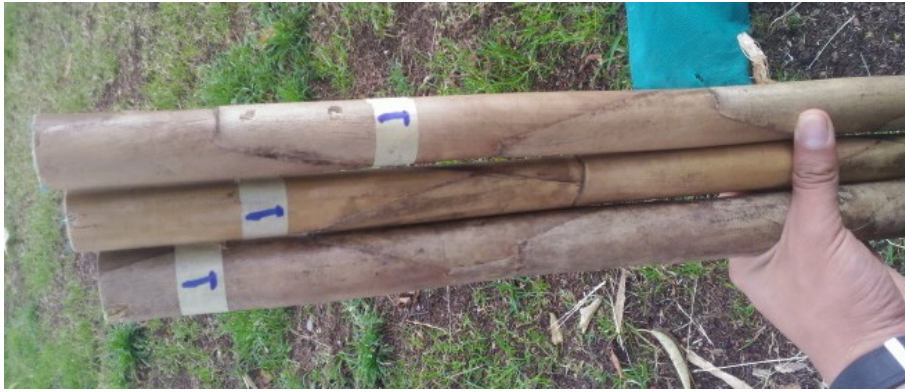
Figura 2 Extracción de fibras caña brava Elaboración propia.

De los procesos de extracción fue seleccionado el procedimiento manual, considerado menos agresivo con la muestra, ya que cuando se emplea el método del trapiche la caña debe soportar la carga del molino, lo que afecta la resistencia posterior de las fibras. Mediante la técnica de MEB se pudo determinar la morfología característica de las fibras analizadas sobre un corte transversal de las muestras, como se puede observar en la figura 3. Se pudo determinar que la morfología característica de los microconstituyentes de la caña brava consta de una pared celular gruesa, con lúmenes de diferentes diámetros, con un área y perímetro de fibra aproximados de 0,35 \text{ mm}^2 y de 0,0023 \text{ mm} , respectivamente, calculando en un promedio de 16 especímenes analizados, como se detalla en la tabla 1. Las características mencionadas hacen que la fibra tenga mayor área para soportar el esfuerzo al concentrar una mayor cantidad de microfibrillas de celulosa [10].