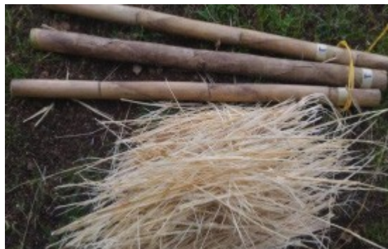
Figura 2 Extracción de fibras caña brava. Elaboración propia.

Mediante la inspección física de las cañas seleccionadas para análisis, se identificó que no presentaban deterioros atribuibles a insectos, hongos, golpes ni grietas, y que su textura y coloración eran apropiadas para la obtención de fibras aprovechables, como se puede observar en la figura 2.