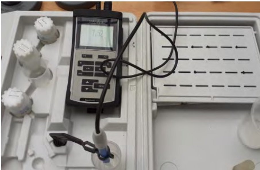
Figura 6 Medidor de pH. Elaboración propia.