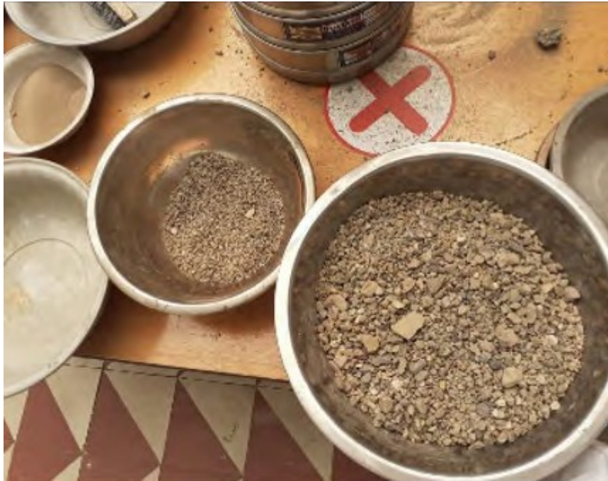
Figura 2 Recipientes utilizados para la organización del material Elaboración propia.

3. Grava y arena Para la elaboración del filtro, se emplearon dos agregados fundamentales: grava y arena (figura 3)