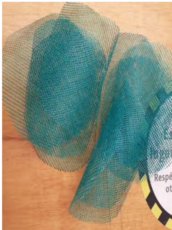
Figura 5 Malla. Elaboración propia.