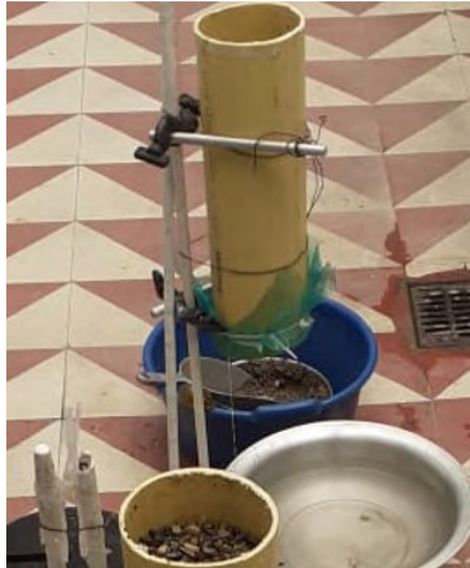
Figura 11 Prueba del filtro 3. Elaboración propia.

Con base en este desarrollo, mediante cálculos elaborados en la herramienta de Excel, se compararon los resultados de las mediciones de los parámetros de interés. Al inicio de cada ensayo se midieron las características del agua cruda, luego se recolectó el agua filtrada y se midieron los parámetros objeto de estudio. El agua cruda presentó un pH de 8,06 y una turbidez de 37,98.