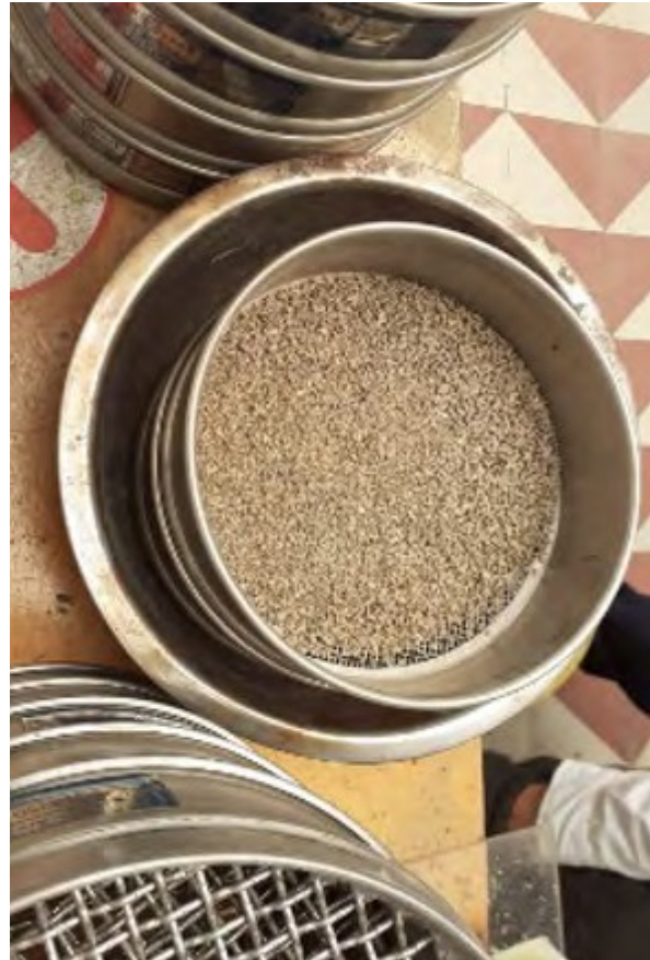
Figura 1 Tamices utilizados para el diseño del filtro Elaboración propia.