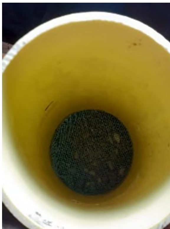
Figura 5. Malla. Elaboración propia.