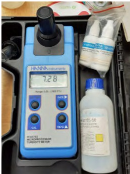
Figura 7. Turbidímetro o nefelometro. Elaboración propia.