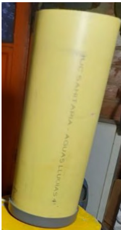
Figura 4 Tubo de PVC. Elaboración propia.

plásticos que permitiesen un mayor ajuste al paso del agua, con dos hembras de \frac{1}{2} " , que en este caso era el diámetro de la tubería del tanque del usuario (figura 4)