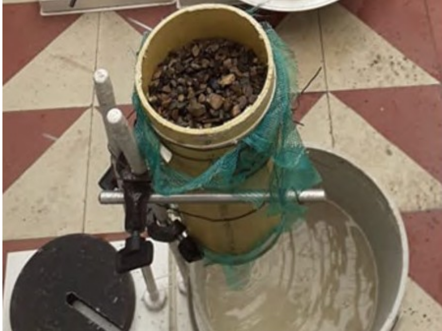
Figura 9. Prueba del filtro 1 Elaboración propia.