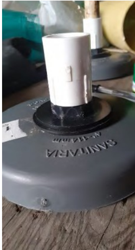
Figura 4 Tubo de PVC. Elaboración propia.