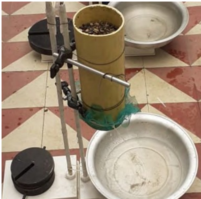
Figura 10. Prueba del filtro 2. Elaboración propia.