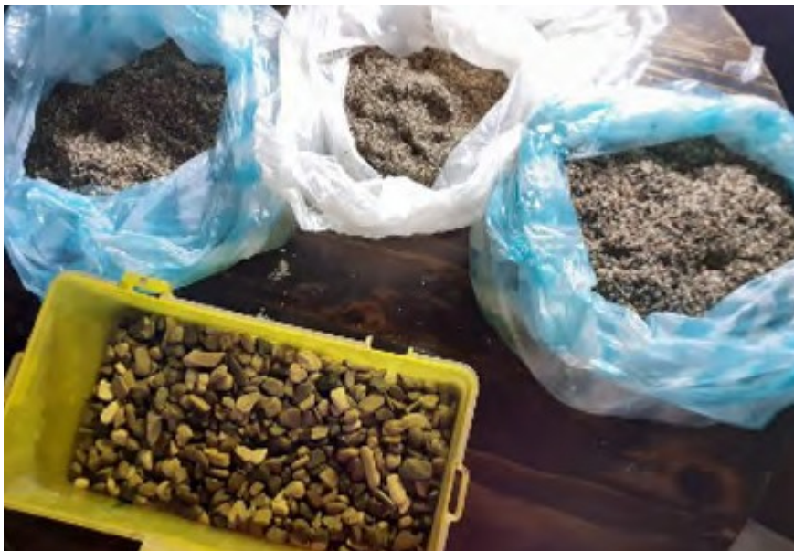
Figura 3. Agregados de grava y arena. Elaboración propia.

3. Grava y arena Para la elaboración del filtro, se emplearon dos agregados fundamentales: grava y arena (figura 3)