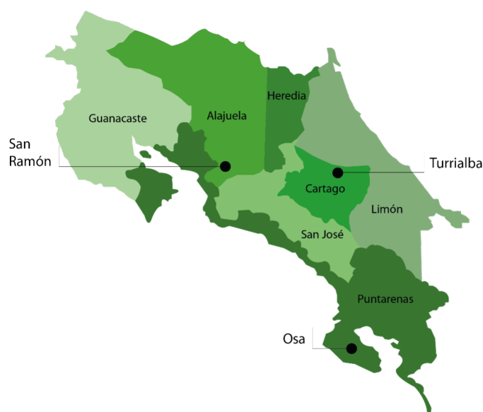
FIGURA 2 Mapa de Costa Rica por provincia, y lugares destacados en las narrativas Nota. Elaboración propia.

Los escenarios dan cuenta de las rutas que han transitado las mujeres migrantes tanto en Colombia como en Costa Rica, espacios en donde ellas construyen sentido, y se desarrolla una vida mediada por el contexto geográfico en el que se encuentran.