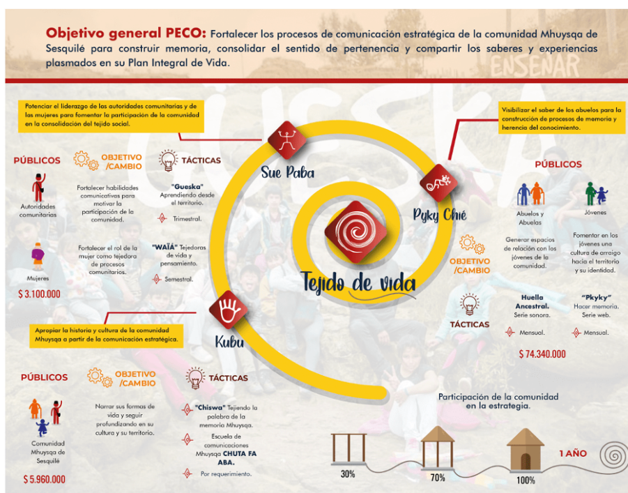
FIGURA 3 Plan Estratégico de Comunicaciones Elaboración propia. (2021)

Como una forma de hacer conciencia y de narrar los pasos que han recorrido, la comunidad Mhuysqa de Sesquile de una manera empírica ha venido desarrollando talleres en fotografía, procesos fotográficos y audiovisuales publicados en sus redes sociales como Facebook, Youtube e Instagram y, de igual manera, han participado con otras organizaciones en producciones audiovisuales que buscan visibilizar la comunidad.