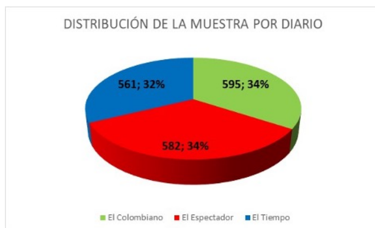
FIGURA 2 Distribución de la muestra por diario Elaboración propia

El 66% de la exposición relevante sobre la industria fue proporcionada por uno de los diarios de referencia de circulación nacional y un diario regional del Departamento de Antioquia (véase Figura 2). Fue una constante que en los tres diarios estudiados primara la valoración NEGATIVA de la exposición de la minería, siendo El Espectador el que aportó un mayor porcentaje (84%), cercano al de El Tiempo (83%), y, en menor medida al de El Colombiano (77%) (véase Tabla 3)