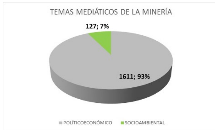
FIGURA 3 Macro temas de la industria minera Elaboración propia

En la Figura 3 se puede apreciar cómo el 93% de los artículos de la muestra trataron temas relacionados con los asuntos político-económicos de la industria (aspectos como liderazgo del sector, estrategia empresarial, marco legal, resultados económicos, recursos humanos y empleo, productos y servicios, innovación, entre otros), versus los temas relacionados con lo socio-ambiental que solo alcanzaron el 7% de la exposición.