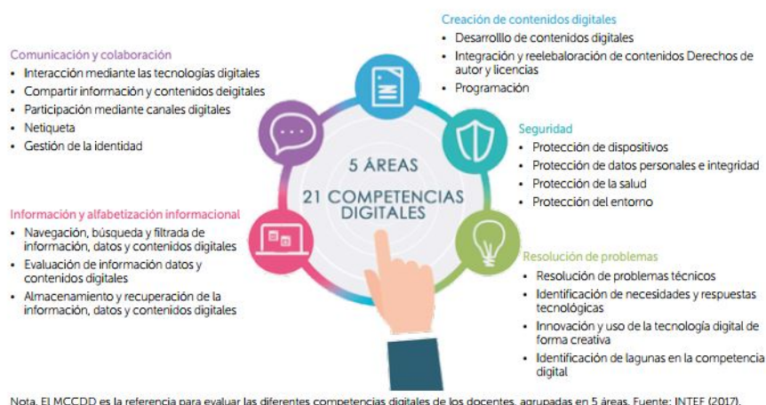
Figura 1 Marco Común de Competencia Digital Docente

La figura 1 traduce los aspectos fundamentales que todo docente debe manejar de manera óptima para asegurar un buen trabajo en el aula. De esta forma, se cuenta con una directriz de lo que se espera conseguir en un docente comprometido con los cambios y con una educación de calidad. Muchas de las competencias señaladas la tienen, pero en otros casos requieren adquirirlas y fortalecerlas mediante la práctica constante. La pandemia que sorprendió con su llegada alrededor del mundo hizo que muchos docentes que no contemplaban el uso de las TIC, tengan que aprender desde un nivel básico hasta ir perfeccionando su uso y alcanzar la experticia que se requiere.