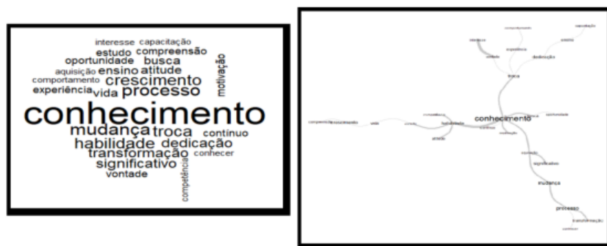
Figura 4 – Nuvem de palavras e Gráfico de similitude construídos a partir da representação da palavra aprendizagem com uso do software IRAMUTEQ Elaborada pelos autores

Assim como a partir do estímulo ensino, a palavra conhecimento destacou-se em meio a crescimento, processo, mudança, troca, habilidade, dedicação, transformação, significativo e outras com menor expressão.