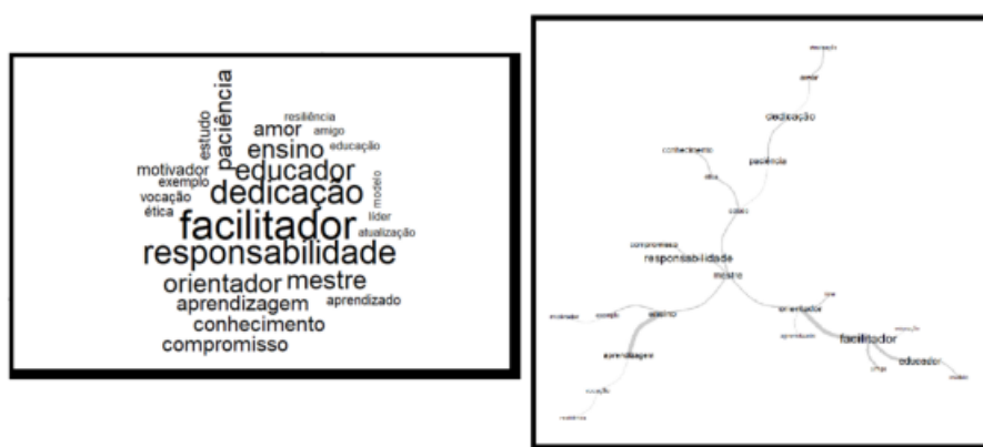
Figura 1 - Nuvem de palavras e gráfico de similitude construídos a partir da representação da palavra professor com uso do software IRAMUTEQ

Os dados estão apresentados a partir da Técnica de Associação Livre de Palavras, usando os estímulos professor, ensino, aluno e aprendizagem, sendo solicitado que, a cada estímulo, fossem referidas cinco palavras. Os dados foram analisados com o apoio do software IRAMUTEQ. Ao utilizarmos a palavra indutora professor, os participantes escreveram as palavras que foram consolidadas inicialmente em uma nuvem de palavras a seguir: