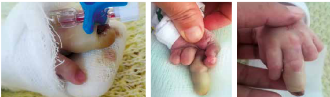
Figura 2. Dedo medio de mano izquierda presenta signos de inflamación con absceso y piel blanquecina; uña negruzca con herida infectada en hiperextensión permanente cubierta con gasas secas

Dedo medio de mano izquierda presenta signos de inflamación con absceso y piel blanquecina; uña negruzca con herida infectada en hiperextensión permanente cubierta con gasas secas