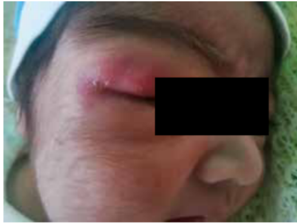
Figura 1. Ojo izquierdo con edema con oclusión ocular parcial y edematizado

Ojo izquierdo con edema con oclusión ocular parcial y edematizado