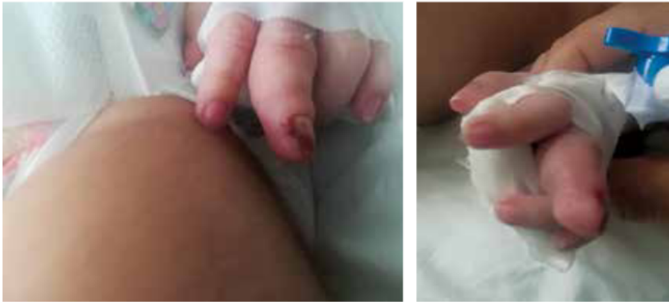
Figura 3. Mano de lado izquierdo, dedo medio, ligeramente edema con uña negruzca

Mano de lado izquierdo, dedo medio, ligeramente edema con uña negruzca Tomografía axial computarizada de tórax mostrando bula respiratoria o ampolla de enfisema