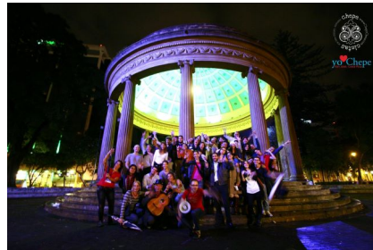
FIGURA 6. Fotografía de “Nocturbano: Conoche San José de Noche”.

ciudad, sitios de valor con potencial de desarrollo urbano. Asimismo, los tours están guiados por personas expertas en las temáticas tratadas y son acompañados por policías municipales que brindan seguridad y vigilancia. ChepeCletas, así, ha optado, por actividades didácticas en las que explican historias poco conocidas del centro de la capital. En el “Nocturbano” por ejemplo, no se busca una interacción entre personas “visitantes” y personas “habitantes”, sino más bien transmitir información y contar anécdotas que terminan por alentar una visión nostálgica y romántica de San José (ver Figura 6).