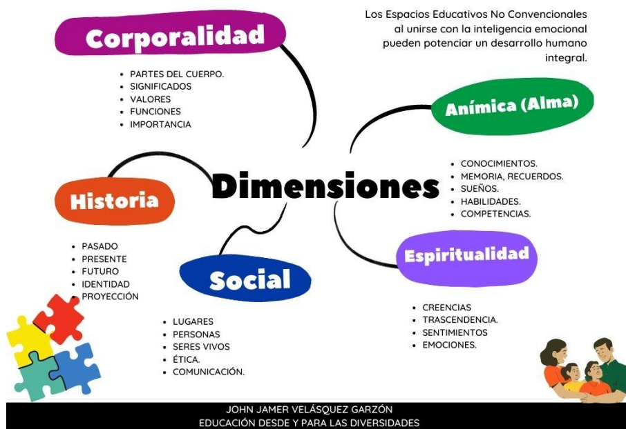
Figura 1. Dimensiones trabajadas en espacios educativos no convencionales elaboración propia