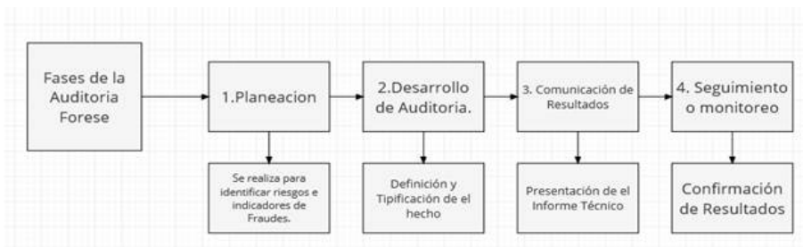
Figura 2 Fases de la auditoría

Para esto, el auditor tuvo que basar en la NIA 335 y conocer su alcance el cual estuvo establecido en identificar y valorar los riesgos en de incorrección en los estados financieros.