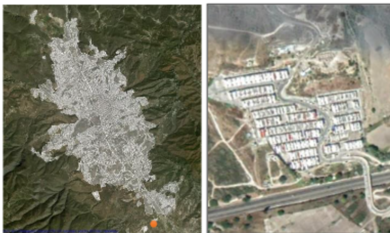
FIGURA 1 Y 2:

Figura 1 y 2: Ubicación del fraccionamiento “Nuevo Mirador” en Chilpancingo.