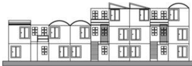
FIGURA 4: Figura 4: Fachada de los departamentos del fraccionamiento “Nuevo Mirador”.

Existen 2 tipos de edificios de departamentos uno de 3 plantas y otro de 2 como se muestra en la figura 4.