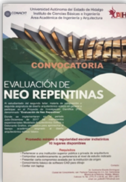
FIGURA 1 Vista del cartel de la edición del 2017.

La dinámica de enriquecimiento informativo consistió inicialmente en buscar recursos financieros del Consejo Nacional de Ciencia y Tecnología o CONACyT (2019) pero sin lograrlos, y convocar a las escuelas de arquitectura del área metropolitana de Pachuca para participar en el proyecto, pero ninguna envió estudiantes. Aun así, gracias al respaldo del Área Académica de Ingeniería y Arquitectura o AAIyA, aunado al apoyo del Despacho de Arquitectura CED, fueron entregados 11 oficios de invitación para la edición del 2017 y 12 para la edición del 2018.