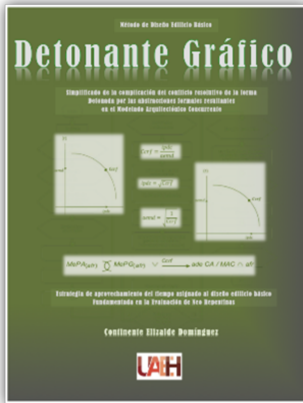
FIGURA 3 Vista de la portada del libro digital “Detonante Gráfico”.

El “Detonante Gráfico” o DG es el método del deb que permite el aprovechamiento teórico y práctico del tiempo. En sentido práctico propicia la fabricación de las fachadas, plantas y cortes o anteproyectos de estas 21 tipologías en 2 de las 4 horas de las neo repentinas porque se concentra en las respuestas y bocetos de 17 preguntas nombradas como abstracciones formales resultantes o afr. Mismas que funcionan como líneas guías en la resolución de los anteproyectos. Teóricamente permite el aprovechamiento del tiempo con la obtención de las afr de ciertas edificaciones sin distinción de época y lugar (Elizalde, 2019c). Se fundamenta en la escala de 11 puntos del Sistema para Valorar la Complejidad del Diseño Arquitectónico Edificio o SIV-DAE (Elizalde & Castillo, 2016). Complejidad entendida como la dificultad que sus diseñadores tuvieron para resolver el anteproyecto de las muestras analizadas, descrita como la Complicación del Conflicto Resolutivo de la Forma o Ccrf.