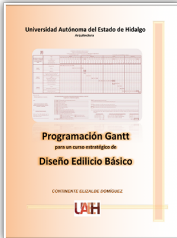
FIGURA 5 Vista de la portada del libro digital “Programación Gantt para un Curso Estratégico de Diseño Edificio Básico”.

Ambos libros buscan el empoderamiento comercial del deb en la materia del crecimiento urbano para volverlo una verdadera fuente de subsistencia propia de quienes deciden abundar en la búsqueda física o virtual del empleo y provocar la llegada de trabajo a distancia mediante la oferta mundial de sus servicios proyectuales.