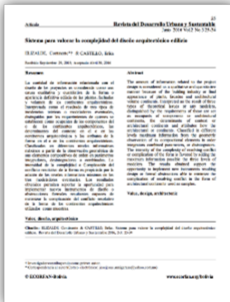
FIGURA 4 Vista de la 1ra página del artículo relativo al SIV-DAE.

Con la pretensión de replicar en otras escuelas los resultados obtenidos con las tecnologías MAC y DG se desarrolla el libro de la “Programación Gantt para un Curso Estratégico de Diseño Edificio Básico” y se imparte al final del año 2017 como seminario a la 10ma generación del Doctorado en Arquitectura, Diseño y Urbanismo (DADU) en la Universidad Autónoma del Estado de Morelos (UAEM). Lo notable de este producto radica en que permite considerar no únicamente el tiempo de clase asignado al deb sino también empezar a contemplar el tiempo extra clase.