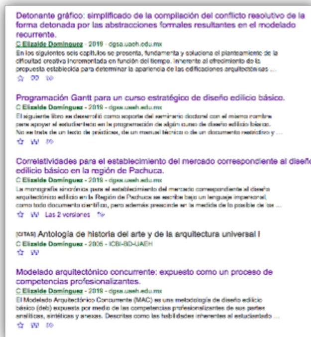
FIGURA 8 Vista del portal de Google Académico.

El otro acceso es largo porque hay que digitar en el portal de Google (2019) “UAEH Biblioteca Digital Principal”. Para visualizar los 5 productos hay que dar click en “Autores”, luego en la “E” y finalmente en “Elizalde Domínguez, Continente”.