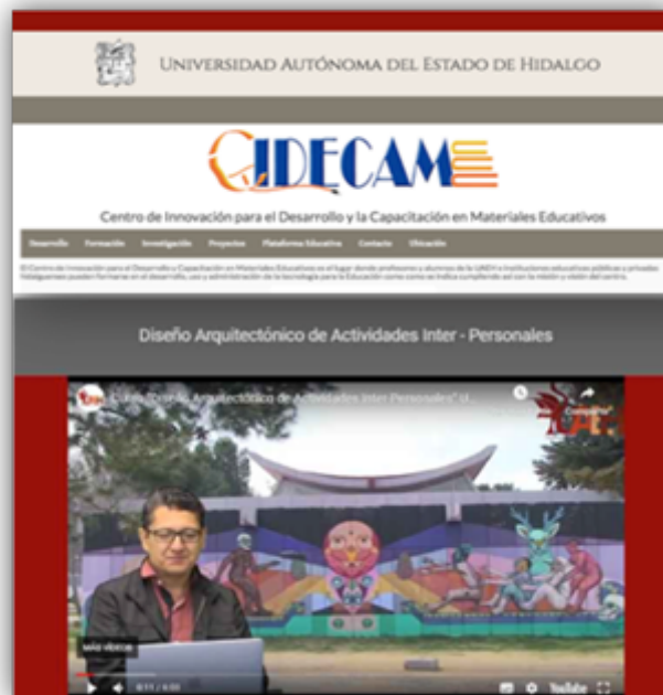
Figura 10 Vista del MOOC para el deb en portal del CIDECAME.

El objetivo consistió en facilitar la enseñanza de la asignatura “Diseño Arquitectónico de Actividades Inter-Personales” de la licenciatura en arquitectura, localizada en 4to semestre como el 2do taller de diseño. Según el plan de estudios registrado en la plataforma de control académico de la UAEH conocida como Syllabus.