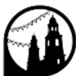
ILUSTRACIÓN 1 Isotipo de la aplicación móvil