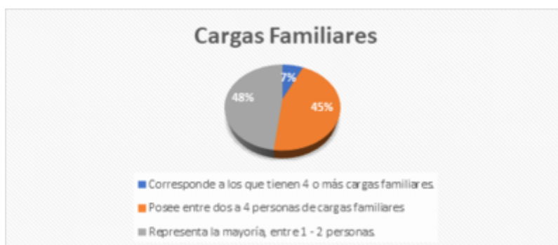
GRÁFICO 2 Cargas Familiares

Del 100 % de las personas encuestadas el 98 % labora a tiempo completo (8 horas diarias o más), mientras que solo el 2 % de las personas labora a tiempo parcial (menos de 8 horas). Se observa que prevalece la jornada de trabajo a tiempo completo.