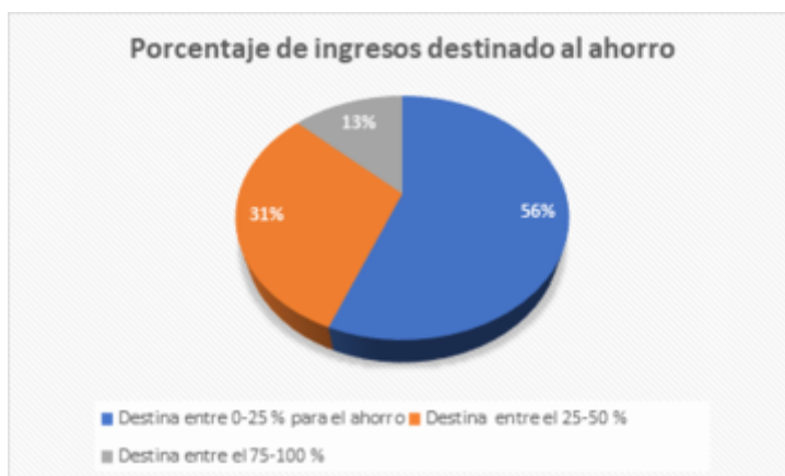
GRÁFICO 5 Porcentaje de ingresos destinado al ahorro Investigación de campo Elaboración propia

El 60% se destina para la inversión hasta el 25% de sus ingresos mensuales, lo que representa la mayoría; mientras que el 30% otorga a este rubro 25 al 50% de sus ingresos; y solo un 10% destina entre el 75 al 100% de sus ingresos a la inversión. Estos resultados son positivos ya que existe una educación financiera en las personas. Aunque puede ser más alta, su capacidad de ahorro es significativa, lo que nos permite interpretar algunos comportamientos del personal encuestado: no deben ser personas en su gran mayoría, consumistas, apegados a lo material, lo que resulta novedoso para el trabajo que se pretende realizar.